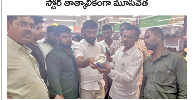
కుళ్లిన రోటీలు ఆహార పదార్థాలు ఉన్న ఫుడ్ ప్యాక్ ను తెరిచి చూపిస్తున్న దృశ్యం

వనపర్తి బోస్, మార్చి 21, ప్రభాతవార్త: వనపర్తి జిల్లాలో ఫుడ్ సేఫ్టీ అధికారులు ఉన్నారా.. సామాన్యులు ఫిర్యాదు చేస్తే తప్పా తనిఖీలు చేపట్టరా.. వారి నిర్లక్ష్యమే ప్రజలు ప్రాణాల మీదకు వస్తుందని వనపర్తి జిల్లా వినిపిస్తున్నాయి. ఆహార భద్రత సమస్యలపై ఫిర్యాదు చేసినందుకు వలమూర్తి కార్యాలయానికి వెళ్లినా అధికారులు ఉండరని, ఫిర్యాదు చేసినా ఎలాంటి చర్యలు చేపట్టడం లేదని ప్రజలు మండిపడుతున్నారు. శుక్రవారం వనపర్తి జిల్లా కేంద్రంలోని లలయన్స్ స్టార్ట్ ప్యాకింగ్ స్టోర్ కు క్షిప్ర ఆహార పదార్థాలు బయట పడటంతో వినియోగదారులు ఫుడ్ సేఫ్టీ, మున్సిపల్ అధికారుల దృష్టికి తీసుకుపోవడంతో వారి అభ్యర్థన మేరకు తనిఖీ చేశారు. పరిశీలనలో భాగంగా కొన్ని ఆహార పదార్థాలు పాచిపోయి, కుళ్లినవి ఉండడం అధికారుల దృష్టికి వచ్చింది. ప్యాకింగ్ మార్కెట్ నిర్వాహకులను వివరణ కోరగా ఆహార పదార్థాలపై ఎవ్విరి తేదీ ఉందిని నిర్లక్ష్యంగా సమాధానం చెప్పారు. కుళ్లిన పదార్థాలను సేకరించి ల్యాబ్ కు పంపించాలని ల్యాబ్ రిపోర్ట్ వచ్చేవరకు స్టోర్ ను మూసివేయాలని నిర్వాహకులను మున్సిపల్ అధికారులు, ఫుడ్ సేఫ్టీ అధికారి పిలిపించి ఆదేశించారు. ఇదిలా ఉంటే వనపర్తి జిల్లా ఆహార భద్రత అధికారుల తనిఖీలు చేపట్టకుండా తూతూ మంత్రంగా తనిఖీలు చేస్తున్నారని ఆహారభద్రత సమస్యలను తీర్చేందుకు నిబద్ధత కలిగిన అధికారులను నియమించాలని ప్రజలు కోరుతున్నారు. ఎవ్విరి డేట్ ఉన్నప్పటికీ ఆహార పదార్థాలు కుళ్లినప్పటికీ అవగాహన లేని వినియోగదారులు ప్రజలు ఉపయోగించి ఆహారోగ్యం దారుణ పడతే బాధ్యులు ఎవరని మండిపడ్డారు.