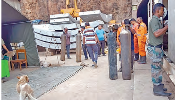
నాగర్ కర్నూల్ ప్రతినిధి, మార్చి 21, ప్రభాతవార్త: నాగర్ కర్నూల్ జిల్లా ఎస్ఎల్బీసీ టన్నెల్ ప్రమాదంపై రెస్పాన్స్ బృందాల నిరంతరంగా శ్రమిస్తున్నాయి. 27కోట్లకు పైగా ఖర్చుతో మౌలిక సౌకర్యం లభ్యమవడంతో మిగతా ఏడుగురి గుర్తింపు సవాలూ మారించి, టన్నెల్లో నిల్వ, బురదను తొలగించే ప్రక్రియ, ఎస్ఎల్బీసీ డ్యారా మట్టి తరలింపు, టన్నెల్ బోరింగ్ మెషిన్ భాగాలను తొలగించు నిరంతరంగా కొనసాగిస్తున్నారు. నాగర్ కర్నూల్ జిల్లా కలెక్టర్ బాదావత్ నంతోమి శుక్రవారం ఎస్ఎల్బీసీ

సాయంత్రం ఆధార్ బెస్ట్ అటెండెన్స్ సిస్టం తీసుకు రావడం వెనకాల ఉన్న ఉద్దేశం ఏమిటో తెలియ జేయాలని ప్రభుత్వం త్వరితగతినే తెలుపాలని డిమాండ్ చేశారు. వైద్య ఆరోగ్య శాఖలోని సబ్ సెంటర్ మొదలుకొని రాష్ట్రవ్యాప్తం వరకు పనిచేస్తున్న ఉద్యోగుల మీద వారి పై సెన్సార్లు ఆధికారులు నిబద్ధతతో పర్యవేక్షించడం మూలంగా ప్రభుత్వం మీద ఆధారపడుతున్న ప్రజలందరికీ మెరుగైన ఉచిత వైద్యం అందుతుందని, దీన్ని దృష్టిలో ఉంచుకొని ప్రభుత్వం వెంటనే ఈ సర్క్యులర్ ను ఉపసంహరించుకోవాలని.. లేకపోతే అన్ని యూనియన్లు, అసోసియేషన్లను కలుపుకొని భవిష్యత్ కార్యచరణ ప్రకటిస్తామని యాద నాయక్ ప్రభుత్వాన్ని హెచ్చరించారు.