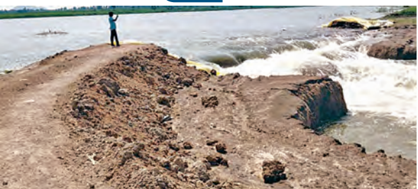
ఎ.బి. కల్వల ప్రాజెక్టు తాత్కాలిక కట్టకు గండి పడడంతో వృధాగా పోతున్న నీరు

జమ్మికుంట/హజారాబాద్, ప్రభాతవార్త: కరీంనగర్ జిల్లా శంకరపట్నం, వీజవంక మండలాలను ఆనుకుని ఉన్న కల్వల ప్రాజెక్టుకు గత మూడు రోజుల క్రితం గండి పడడంతో, సుమారు 3000 ఎకరాలలో వేసిన వరిపంట ఎండిపోయే ప్రమాదం ఏర్పడింది. ఈ కల్వల ప్రాజెక్టును 1970లో అప్పటి ప్రభుత్వం నిర్మించింది. శంకరపట్నం, వీజవంక, జమ్మికుంట మండలాల పరిధిలో దీని పాఠకం అధికంగా ఉంటుంది. తెలుగు దేశం పార్టీ హయాంలో ఈ ప్రాజెక్టుకు అధిక వర్షాల వల్ల గండిపడడంతో, అనాడు మంత్రిగా ఉన్న ముద్దసాని దామోదర్ రెడ్డి సహకారంతో పూర్తిస్థాయిలో మరమ్మత్తులు చేసారు. ఒకనాడు సైదాపూర్, హుస్సానాబాద్ మండలాల పరిధిలోని కొంత భాగం వరకు ఈ ప్రాజెక్టు నీరు అందేది. అలాంటిది రెండేళ్ల క్రితం ఈ ప్రాజెక్టుకు పెద్ద ఎత్తున గండి పడడంతో ఈ ప్రాంత రైతులు తాత్కాలికంగా మత్తడి ఎగువ భాగాన తూముల ద్వారా వంట పొరాలకు నీరు అందేలా, ఈ ప్రాంత రైతులు రింగ్ బాండ్ కట్టలు నిర్మించుకున్నారు. గత నాలుగు నెలల క్రితం ప్రాజెక్టులోకి ఎన్నో రెస్సె ప్రధాన కార్యాల నుండి గేట్లు తెరచి, ప్రాజెక్టులోకి నీళ్లు విడుదల చేసారు. దీనితో వేసేగి వరి పంటను కల్వల, కావూర్, వీజవంక మండలాలలోని మల్లన్నపల్లి, బ్రాహ్మణపల్లి, వీజవంక, నర్సంగిపూర్, కనపల్లి, రామకృష్ణపూర్, రెడ్డిపల్లి, పోర్లెడ్డిపల్లి, జమ్మికుంట మండలాలలోని గోవిందపూర్, బిలాసాగర్, తనసూర్ గ్రామాల్లో రైతాంగం పెద్ద మొత్తంలో నాణ్య వేసారు. ప్రస్తుతం గండిపడడంతో, బ్రాహ్మణపల్లి గ్రామంలో అనేక