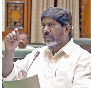
చారు. తర్వాత వచ్చే ప్రభుత్వానికి దక్కాల్సిన అవాయాన్ని కూడా ముందే తీసుకున్నారని మండిపడ్డారు. కెనెఆర్ నెరవేర్చిన హామీలు ఇచ్చి ప్రజల్ని మోసం చేశారని తీవ్ర స్థాయిలో ధ్వజమెత్తారు. బిఆర్ఎస్ ప్రభుత్వం పదేళ్లలో రూ.లక్షల కోట్ల ఖర్చు చేయలేదని చెప్పారు. >>2

విషయాలు స్వయంగా కాగ్ బయటపెట్టిందని పేర్కొన్నారు. గత ప్రభుత్వం ఏనాడూ నిధులను పూర్తిగా ఖర్చు చేయలేదు. భారీగా బడ్జెట్ పెట్టినా నిధులను పూర్తిగా ఖర్చు చేయలేదన్నారు. 2016-17లో రూ.8వేల కోట్లు, 2018-19లో రూ.40వేల కోట్లు, 2021-22లో రూ.48వేల కోట్లు, 2022-23లో రూ.52వేల కోట్లకు పైగా, 2023-24లో రూ.58,571 కోట్లు ఖర్చు చేయలేదన్నారు. ఓఆర్ఎస్ రూ.7వేల కోట్లకే 30 ఏకైకంగానే అమ్ముకున్నారని, డొడ్డిదారిన ఓఆర్ఎస్ ప్రభుత్వ భూములను అమ్ముకున్నారని ఆరోపించారు.