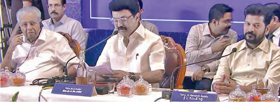
చెన్నైలో శనివారం జరిగిన అఖిల పక్ష భేటీలో సీఎం రేవంత్, తమిళ సీఎం స్టాలిన్, కేరళ సీఎం పినరయి