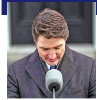
బడ్డావూ, మార్చి 7: తన పదవీకాలంలో కెనడాను ప్రపంచదేశాల్లో మిన్నగా చూపించేందుకే కృషి చేసానని, నిరంతరం కెనడా ఫస్ట్ అన్న భావన