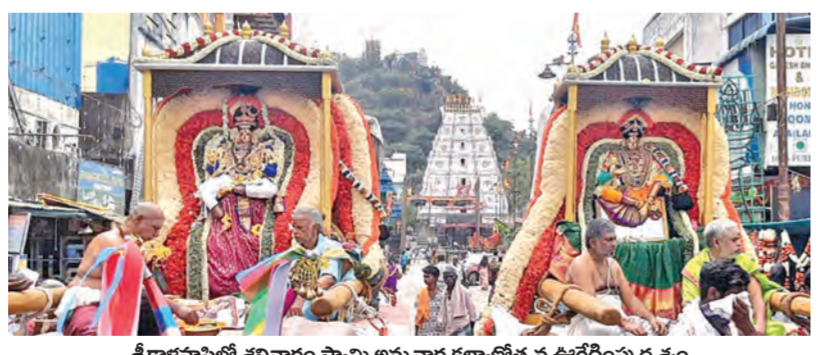
శ్రీకాళహస్తిలో శనివారం స్వామి అమ్మవార్ల కళ్యాణోత్సవ ఉర్రేపింపు దృశ్యం