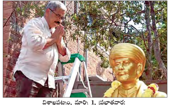
విశాఖపట్నం, మార్చి 1, ప్రభాతవార్త: