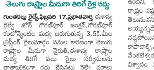
తెలంగాణ రాష్ట్రాల మీదుగా తిలగ రైల్వే రద్దీ

గుంతకల్ రైల్వే స్టేషన్లో 17 ప్రభాతవార్త ఈశాన్య రైల్వే జోన్ గోరఖపూర్ జంక్షన్, గోరఖపూర్ కంటోన్మెంట్ల మధ్య జరుగుతున్న 3.5 కి.మీ. త్రెడ్ గేజీ రైలు మార్గం పనులు శాంతంగా తెలుగు రాష్ట్రాల మీదుగా వైపుకి ఈశాన్య రాష్ట్రాల మధ్య తిలగ వల రైలు సర్కిల్ కు చెందిన తాత్కాలికంగా రద్దు చేసినట్లు రైల్వే పథకాలు తెలిపాయి.