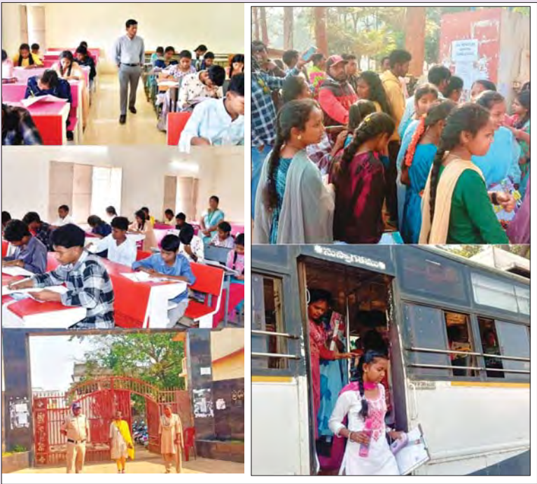
పాడేరు,మార్చి 17, ప్రభాతవార్త: