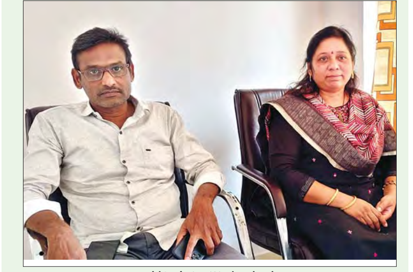
చింతపల్లి మార్చి 17 ప్రభాతవార్త.