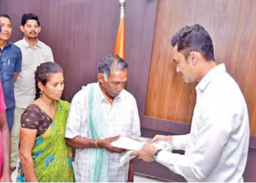
పార్లమెంటు (మాన్యం శిల్ప) మార్చి 17 ప్రభాతవార్త సినిమాలో చూపించే సన్నివేశాలు, సంఘటనలు అప్పుడప్పుడు నిజ జీవితంలో కూడా జరుగుతుంటాయి.