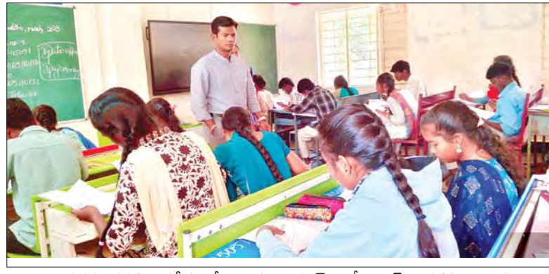
పాడేరు, మార్చి 17, ప్రభాతవార్త: