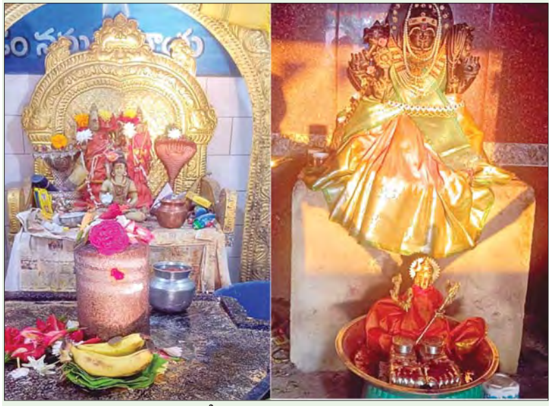
పాడేరు,మార్చి 17, ప్రభాతవార్త: