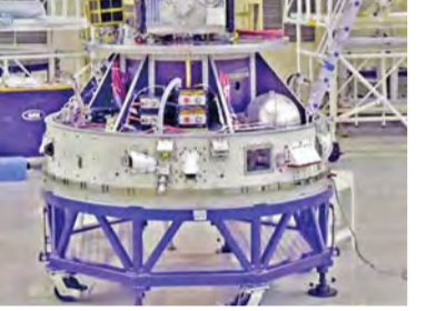
చిన్న రాకెట్ ప్రయోగంలో వాడే స్ట్రెల్

శ్రీకాళహస్తి (తరు), మార్చి 17 ప్రభాతవార్త భారత అంతరిక్ష పరిశోధన సంస్థ ఇస్రో చిన్న రాకెట్ల తయారీని అభివృద్ధి చేసే ప్రయత్నం చేస్తోంది.