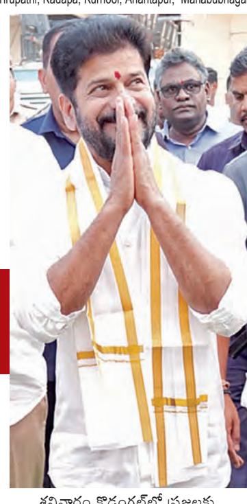
శనివారం కొడంగల్లో ప్రజలకు అభివాదం చేస్తున్న సీఎం రేవంత్