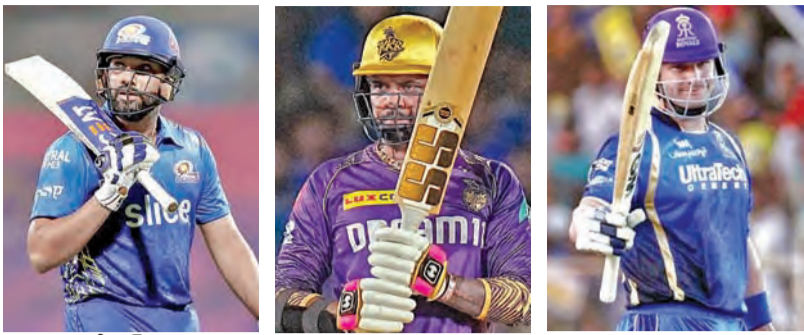
రోహిత్ శర్మ, సునీల్ నరైన్, వివేక్ షర్మ

ఢిల్లీ: ఇండియన్ ప్రీమియర్ లీగ్ (ఐపిఎల్)-2025, 18వ సీజన్ ఉత్సాహంతో సాగుతోంది. అయితే గత ఐపిఎల్లో నమోదైన పాత రికార్డులకు ప్రమాదం పొంది ఉన్నట్లే. ప్రతి సీజన్లో ఉన్న రికార్డులు బద్దలై కొత్త రికార్డులు పుట్టుకొస్తుండటం సర్వసాధారణం. కానీ, కొన్ని అరుదైన ఫీట్లను అందుకోవడం మాత్రం అంత తేలిక కాదు. ఐపిఎల్లో పేరిట అరుదైన రికార్డ్ ఈ సీజనులో ఎవరికి సాధ్యమవుతుందనేది ఆసక్తికరమవుతోంది. అదేంటంటే ఇండియన్ ప్రీమియర్ లీగ్ చరిత్రలో