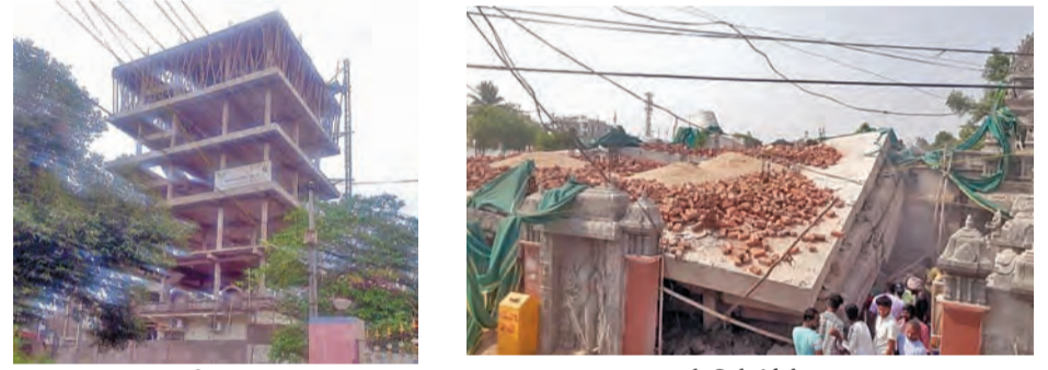
నిర్మాణంలో ఉన్న భవనం కూలిన భవనం