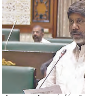
రోజులకు ఒకసారి ఎన్పీడీసీఎల్ ఎన్పీడీసీఎల్ జెన్కో ట్రాన్స్కో అధికారులతో సమీక్ష చేసి సమగ్ర యాక్ష్ ప్లాన్ ముందుకు తయారు చేసుకోవడం వలన ఇప్పుడు పెరిగిన పిక్ డిమాండ్ ను తట్టుకున్నామన్నారు. రాష్ట్ర ప్రభుత్వం ప్రజలకు ఇప్పుడు సబ్సిడీ, ఉచిత కరెంటుకు సంబంధించిన డబ్బులను ప్రతినెల డిస్కంలకు చెల్లింది వాటిని బలోపేతం చేస్తున్నామన్నారు. రాష్ట్రంలో ఒక కోటి 94 లక్షల 61వేల 511 విద్యుత్ కనెక్షన్లు ఉండగా 29 లక్షల 14 వేల 692 వ్యవసాయ కనెక్షన్లకు ఉచితంగా అందిస్తున్న కరెంటుకు సంబంధించి ఇప్పటి వరకు డిస్కం సంస్థలకు 1922.31 కోట్ల రూపాయలను ఆర్థిక శాఖ చెల్లింది. రాష్ట్రంలో రోజు రోజుకు పెరుగుతున్న విద్యుత్ అవసరాలను తీర్చడానికి న్యూ ఎన్టీ పాలసీని ప్రజా ప్రభుత్వం తీసుకువచ్చింది. 2030 నాటికి 20వేల మెగావాట్లు, 2035 నాటికి 40 వేల మెగావాట్లు విద్యుత్ ఉత్పత్తి పెంచడానికి లక్షలగా పెట్టుకున్నామన్నారు. రాష్ట్రంలో న్యూ ఎన్టీ పాలసీ తీసుకురావడం వల్ల రాష్ట్రానికి లక్ష కోట్లకు పైగా పెట్టుబడులు పెట్టడానికి వివిధ సంస్థలు మన

ప్రభుత్వంలో ఎంపీయూ చేసుకున్నాయని తెలిపారు. స్వయం సహాయక సంఘాల మహిళాతో వెయ్యి మెగావాట్ల సోలార్ విద్యుత్ ఉత్పత్తి చేయడానికి సెన్ట్రల్ ఎన్టీ శాఖల మద్దన ఎంపీయూ చేశామన్నారు. మహిళలకు వడ్డీ లేకుండా రుణాలు ఇవ్వడంలో పాటు సోలార్ విద్యుత్ ఉత్పత్తి చేయడానికి కావలసిన సహకారం అందించి వారు ఉత్పత్తి చేసిన కరెంటును ప్రభుత్వమే కొనుగోలు చేసి వచ్చిన లాభాలతో మహిళలు ఆర్థికంగా నిలుదొక్కకోవడానికి వ్యవస్థను ఏర్పాటు చేశామన్నారు. రాష్ట్రంలోని రైతులకు పంటలో పాటు పవర్ కూడా అదాయం రావాలని వ్యవసాయ పంపునిట్లకు సోలార్ ఏర్పాటు చేస్తున్నామన్నారు. ఇరిగేషన్ ప్రాజెక్టుల వద్ద ఉన్న షాజీ స్టలంలో సోలార్ పవర్ ప్లాంట్ ఏర్పాటు చేయడానికి, బాలర్ బాడీలో షాజీలో సోలార్ ప్లాంట్స్ ఏర్పాటు చేయడానికి, సింగరేణి బొగ్గ బావుల్లో పంపుల్లో స్టోరేజీ విద్యుత్ ప్లాంట్లు ఏర్పాటు చేయడానికి ప్రభుత్వం కార్యచరణ ప్రణాళికలు తయారు చేసుకొని ముందుకు పోతున్నదన్నారు. (డ్రీప్), స్పింకర్ ఇచ్చి హార్వెస్టులో పంటలు సాగు చేయడానికి ప్రోత్సాహం ప్రభుత్వం, దేవదాయ ధర్మాదాయ శాఖలో షాజీ ఉన్న భూములను గుర్తించి అక్కడ సోలార్ పవర్ ప్లాంట్ ఏర్పాటు చేయడానికి వర్తమా తీసుకుకున్నామని తెలిపారు. వైదరాబాద్ మహానగరంలో పుటోపాతలు ఆక్రమణకు గురి కాకుండా వాటిపైన రూప సోలార్ ఉత్పత్తి కార్యాచరణ ప్రణాళికను తయారు చేస్తున్నామని తెలిపారు. వినియోగదారులు విద్యుత్ సేవలు సులభతరంగా పొందడానికి కన్స్ట్రుయర్ యాప్, వెబ్సైట్లు ప్రారంభిస్తారు. విద్యుత్ వ్యవస్థను బలోపేతం చేస్తూనే ఉద్యోగులను కూడా పెంచుతున్నామన్నారు.