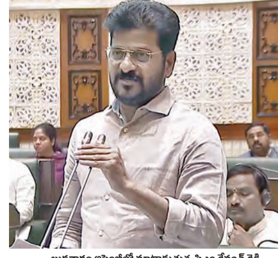
బుధవారం అసెంబ్లీలో మాట్లాడుతున్న సిఎం రేవంత్ రెడ్డి

అవసరమైతే చట్టాన్ని సవరిస్తాం.. సిట్ ఏర్పాటు ఉప ఎన్నికలు రావు.. ఆందోళన వద్దు గచ్చిబౌలి భూమికి, సెంట్రల్ వర్క టీకి సంబంధం లేదు అసెంబ్లీలో సిఎం రేవంత్ రెడ్డి