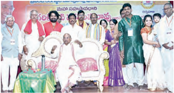
ప్రసంగిస్తున్న మహాసహస్రాబధాని డాక్టర్ గరికపాటి నరసింహారావు