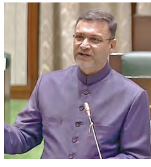
ఇక రాష్ట్రంలో నేరాల సంఖ్య ఏటా పెరుగుతున్నా ఉందని, ఎవరు నేరస్థులు, ఎవరు కాదనేది పోలీసులకు పూర్తిగా తెలుసునన్నారు. పోలీస్ స్టేషన్లలో సెటిల్ మెంట్లు జరుగుతున్నాయని, ప్రధానంగా భూవివాదాల పరిష్కారంలో తలమునకలయ్యాయని తీవ్ర ఆరోపణలు చేశారు. పోలీస్ స్టేషన్లు భూవివాదాల పరిష్కారంలో నిమగ్నమై ఉండడం వల్లే నేరాలు పెరుగుతున్నాయని, ఇకనైనా పోలీసులు ఆ పంచాయితీలు వక్కన పెట్టి శాంతిభద్రతల పరిరక్షణ చేపట్టాలా చూడాలని చెప్పారు. రాష్ట్రంలో క్రైమ్ రేటు పెరిగిందన్నారు. ఇది సమయంలో మహిళలపై అత్యుత్సాహ సంఘటనలు కూడా ఎక్కువయ్యాయని ప్రభుత్వం దృష్టికి తీసుకోవాలన్నారు. అలాగే కొత్త రేపన్ కార్యలు, ఇళ్ల రాక దరఖాస్తు చేసుకుని వాటిని పేద వర్గాలు ఎదురు చూస్తున్నాయని తెలిపారు.

వైదరాబాద్, మార్చి 26. ప్రభాతవార్త: డిమాండ్ పెరుతో తెలంగాణ విద్యుత్ సంస్థలు కొనుగోలు చేస్తున్న కరెంటుకు గతం కంటే ఎక్కువ రేటు పెడుతున్నాయని ఎంపిఎం పక్ష నేత అక్షయ్ దీప్ అసహనం. శాసనసభలో వివిధ పద్దులపై బుద్ధవారం జరిగిన చర్చలో ఆయన పాల్గొంటూ ఈ ప్రభుత్వ హయాంలో జరిగిన తప్పులను కాంగ్రెస్ కొనసాగిస్తోందని విమర్శించారు. అధిక ధరలకు విద్యుత్ను కొనుగోలు చేస్తున్నా ఎవరూ ప్రశ్నించడమే రాష్ట్ర ప్రభుత్వంపై తీవ్ర అసహనం వ్యక్తం చేశారు. ఇలా అధిక ధరలకు కొనుగోలు చేస్తున్నా ఎందుకు విద్యుత్ సంస్థలను ప్రశ్నించడం లేదని నిలదీశారు. గతంలో కంటే విద్యుత్ ధరలను పెంచి కొనుగోళ్లు జరుగుతున్నాయని, ఇది మాత్రం ఎవరికీ ఎందుకు కనిపించడం లేదని విమర్శించారు. ప్రభుత్వ శాఖల నుండి భారీ ఎత్తున విద్యుత్ బకాయిలు రావాల్సి ఉందని, వాటిని ఎందుకు చెల్లింపట్టడమే సర్కారు ప్రశ్నించారు. పాతపేజీలో విద్యుత్ వినియోగం సంబంధించి నష్టాలు వస్తున్నట్లు పదివేల చెబుతున్నారన్నారు. కానీ, ఇబ్రహీం నాథ్ ప్లాటెస్ట్ విద్యుత్ కేంద్రం ఏర్పాటుకు ఐదేకరాలు కావాలని ప్రభుత్వానికి ఎన్నిసార్లు విజ్ఞప్తి చేసినా స్టంపించ లేదని తెలిపారు.