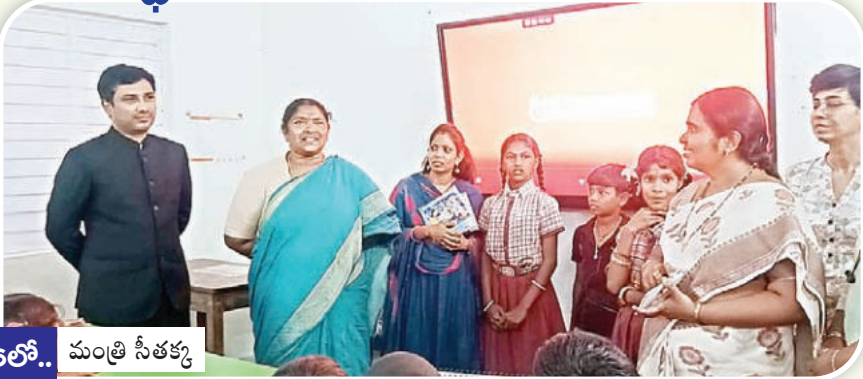
16లో.. మంత్రి సీతక్క