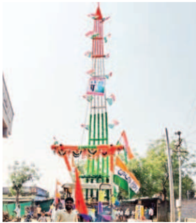
కలగకుండా వారు తగిన బందోబస్తు ఏర్పాటు చేశారు.