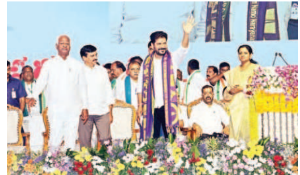
తీవ్రంగా విరుచుకుపడ్డారు. కేటీఆర్, హరీశ్ రావు పిల్ల కాకులలాగ ఎగసిపడుతున్నారని, వారితో మాట్లాడాల్సిన పనిలేదన్నారు. కేటీఆర్ ఎప్పుడు వచ్చినా మాట్లాడేందుకు, ఏ విషయంపై అయినా చర్చకు సద్దమని సీఎం రేవంత్ రెడ్డి సవాల్ విసిరారు. "మీ అల్లుడు, కొడుకు పిల్ల కాకులు... వాళ్లతో అరుస్తుంటారు... కాంగ్రెస్ దెబ్బ ఏంటో మీకు తెలుసు.. 2023 డిసెంబర్ లో చూశారు కదా.. అందుకే మీరు రండి కేసీఆర్. మీరెప్పుడొస్తే అప్పుడు చర్చకు నేను సిద్ధం.." అని కేసీఆర్ కు సీఎం రేవంత్ రెడ్డి సవాల్ విసిరారు. కాంగ్రెస్ రాష్ట్రానికి ఏం చేయలేదని హరీశ్ రావు అంటున్నారని, శ్రీరాంసాగర్ మీతాత గట్టిండా, శ్రీశైలంలో నీటి నిల్వ మీ ముత్తతా చేసిండా" అని ఘాటుగా ప్రశ్నించారు. తెలంగాణలో శ్రీశైలం, నాగార్జునసాగర్, నెల్లెంపాడు, జూరాల ఇలా చెప్పుకుంటూ పోతే ప్రాజెక్టులన్నీ కాంగ్రెస్ కట్టినవేనని తెలియచేశారు.

తెలంగాణ అప్పులు, అభివృద్ధిపై, రాష్ట్రంలో కాంగ్రెస్ చేసిన అభివృద్ధిపై పిల్లకాకులతో కాకుండా డైరెక్ట్ గా కేసీఆర్ తోనే మాట్లాడతానని సీఎం రేవంత్ రెడ్డి అన్నారు. ఈసందర్భంగా మాజీ మంత్రి హరీశ్ రావుపై