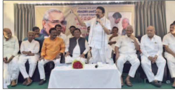
అలోచించుకోవాలి.. పోరాటాల ఖిల్లా ఓరుగల్లు జిల్లాలో అత్యధిక ఎమ్మెల్యే సీట్లు ఇప్పటికైనా గెలువాలి... ఆ దిశగా నాయకులు ఇప్పటినుండే ప్రణాళికలు సిద్ధం చేయండి..

తెలంగాణ రాష్ట్రంలో అత్యధిక ఎమ్మెల్యే సీట్లు గెలుచుకుని బీజేపీ జెండా ఎగురవేసి సీఎం సీటు కైవసం చేసుకున్న రోజే అటల్ కు నిజమైన నివాళులు.. కాశ్మీర్ నుండి కన్యాకుమారి వరకు భారతీయ జనతా పార్టీ విస్తరిస్తుంది కానీ తెలంగాణలో ఎందుకు సాధ్యం కావడం లేదో నాయకులు