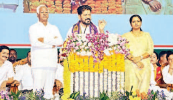
కోచ్ ఫ్యాక్టరీ వచ్చిందన్నారు. రైతురుణమాఫీ చేసినందుకు నాపై కోపం ఉంటుందా..? లక్ష కోట్లు సంపాదించే నైపుణ్యం ఎంటో మా యువతకు నేర్పాలన్నారు.

తెలంగాణలో కాంగ్రెస్ సాగునీటి ప్రాజెక్టులు కట్టలేదన్న హాంబరాలకు సీఎం రేవంత్ సవాల్ విసిరారు. కేసీఆర్ లక్షకోట్లు పెట్టి కట్టిన కాశేశ్వరం ప్రాజెక్టు మూడేళ్లలోనే కూలిపోయిందని, అది కాశేశ్వరం కాదు కాశేశ్వరం అని ఎద్దేవా చేశారు. కేసీఆర్ రోజూ ఇంట్లో రొయ్యల పులుసుతినీ, ఏపీ కృష్ణా జలాలను తరలించుకుపోతుంటే పట్టించుకోలేదని సీఎం రేవంత్ రెడ్డి ఆరోపించారు. అసెంబ్లీకి రాని కేసీఆర్కు రూ.58లక్షల జీతం, పోలీసుల పహారా ఎందుకని సీఎం ప్రశ్నించారు. ఏనాడైన గత ప్రభుత్వం మహిళలను ఆడుకుందా.. మహిళలకు వడ్డీలేని రుణాలు ఇచ్చిందా.. అసలు పట్టించుకుందా అని ప్రశ్నించారు. మా అప్పులు ఎలా పెరిగాయి.. మీకు లక్షకోట్ల ఆస్తులు ఎలా వచ్చాయని ముఖ్యమంత్రి ప్రశ్నించారు. కొందరు దోపిడీ దొంగలకు నా మీద కోపం ఉండవచ్చు.. కేసీఆర్ అన్నింటికీ బకాయిలు పెట్టి వెళ్ళాడన్నారు. మా ప్రభుత్వం వచ్చాకే వరంగల్కు ఎయిర్ పోర్ట్ వచ్చిందని, వరంగల్ కు ఔటర్ రింగ్ రోడ్డు కూడా మా ప్రభుత్వం వచ్చాకే వచ్చిందన్నారు. అంతే కాదు మా ప్రభుత్వం వచ్చాకే కాజీపేట రైల్వే