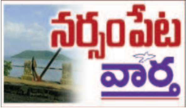
యునివర్సిటీకి సురవరం పేరుపెట్టడం అభినందనీయం నల్లబెల్లి, మార్చి 18, ప్రభాతవార్త