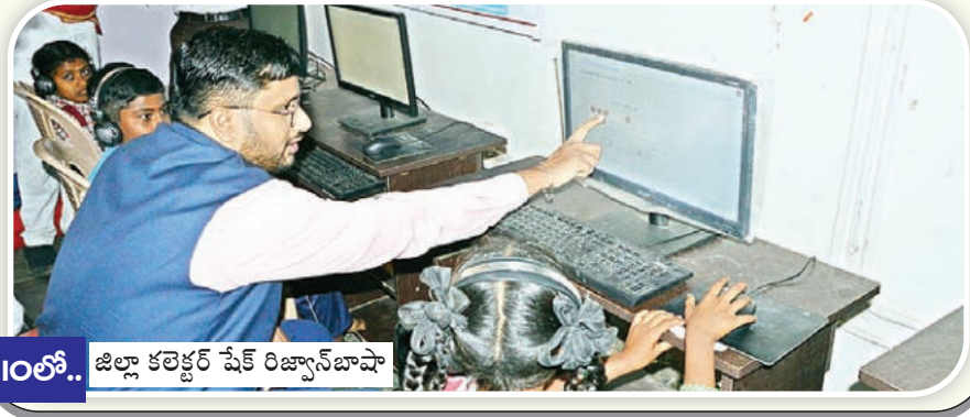
10లో.. జిల్లా కలెక్టర్ షేక్ రిజ్వాన్ బాషా