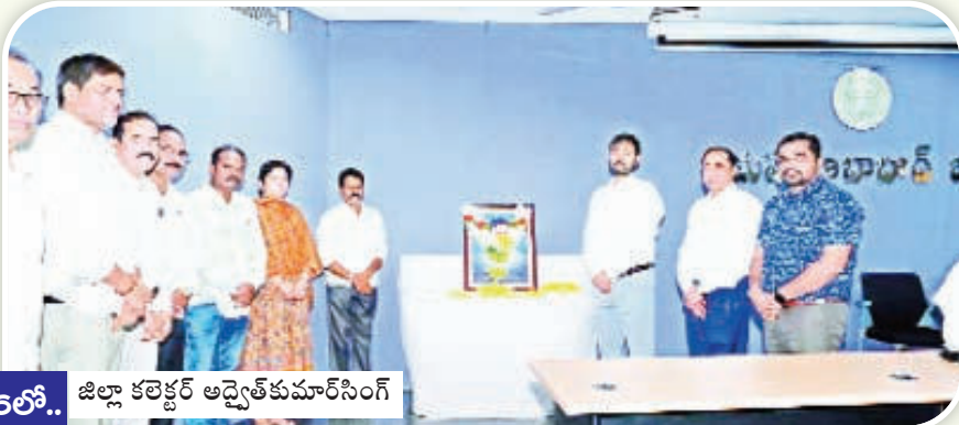
16లో.. జిల్లా కలెక్టర్ అద్వైత్ కుమార్ సింగ్