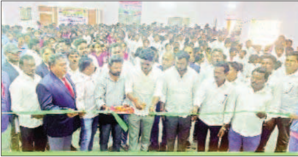
తాడ్యాయి ప్రభాతవార్త(02 మార్చి)