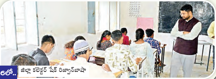
16లో.. జిల్లా కలెక్టర్ షేక్ రిజ్వాన్ బాషా