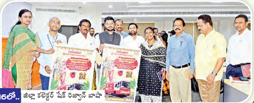
16లో.. జిల్లా కలెక్టర్ షేక్ రిజ్వాన్ బాషా