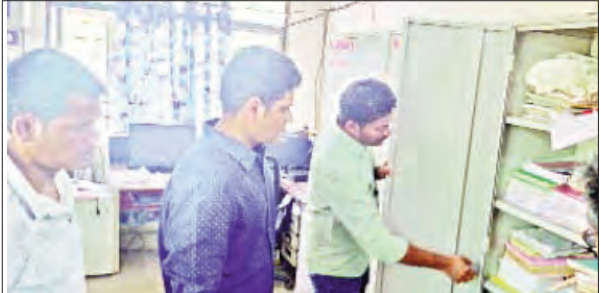
ములుగు జిల్లా ప్రభాత వార్త.