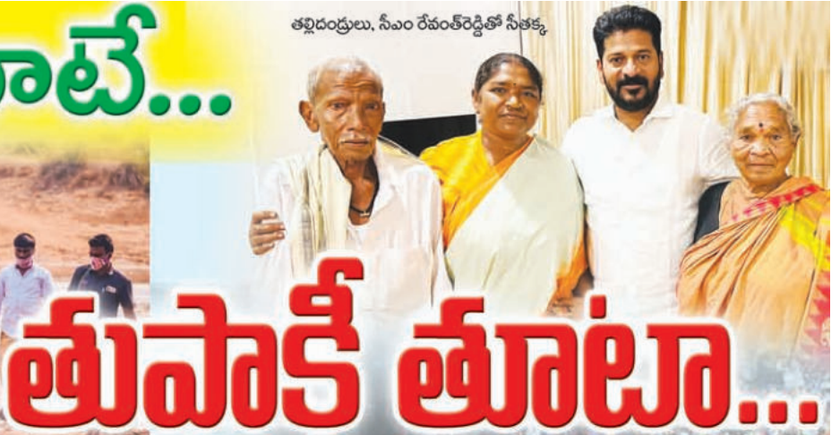
తల్లిదండ్రులు, సీఎం రేవంత్ రెడ్డితో సీతక్క

మహిళా దినోత్సవం సందర్భంగా మంత్రి సీతక్కపై వార్త ప్రత్యేక కథనం