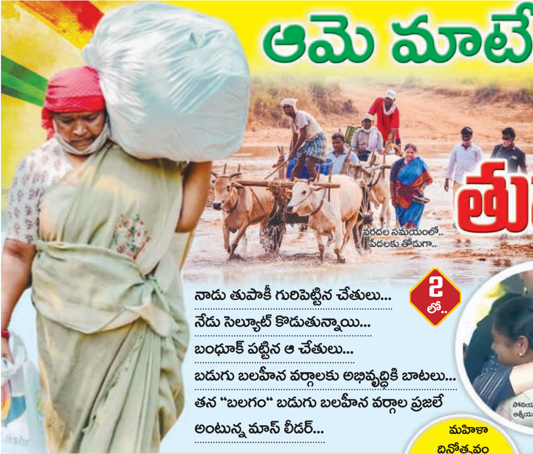
వరదల సమయంలో.. పేదలకు తోడుగా..