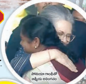
సోనియా గాంధీతో ఆత్మీయ అలింగనం