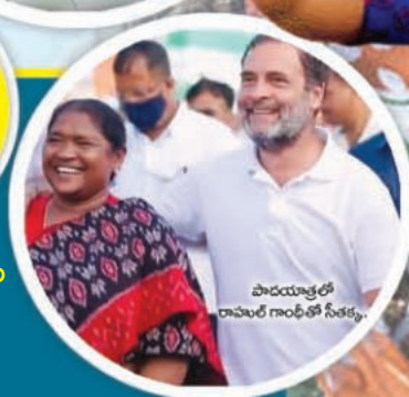
పాదయాత్రలో రామాల గాంధీతో సీతక్క