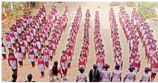
9ఎంపిపి హెచ్.ఎస్, జియుపిఎస్5,