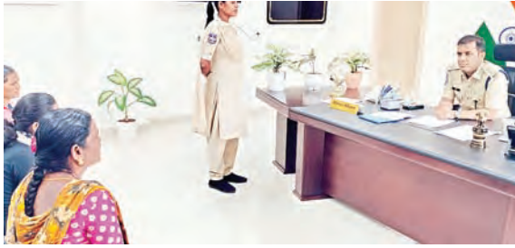
అయా పోలీస్ స్టేషన్ అధికారులతో ఫోన్ ద్వారా మాట్లాడారు. సామాన్య ప్రజలకు పోలీసులు అండగా ఉండాలని, వారితో స్నేహభావంతో