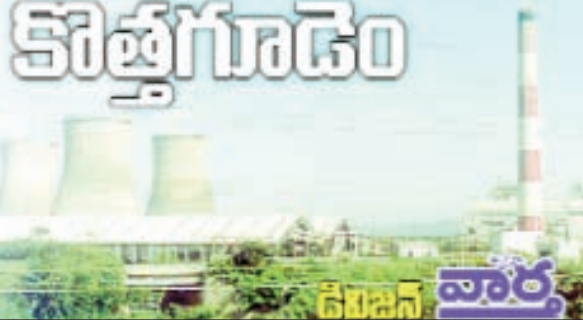
చుంచపల్లి, జూలూరుపాడు, సుజాతనగర్