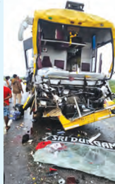
మజ్జు నుజ్జయిన టిల్టేజీ బస్సు, ముందుభాగం

లారీని ఢీకొన్న వోల్టేజీ బస్సు, 18 మందికి తీవ్ర గాయాలు మక్తల్లో, జూన్ 12 ప్రభాతవార్త: మక్తల్ మండల శివారులో గల జక్కేర్ వద్ద గురువారం తెల్లవారు జామున ఘోర రోడ్డు ప్రమాదం జరిగింది. 30 మంది ప్రయాణికులతో ఉన్న వోల్టేజీ బస్సు లారీని ఢీకొన్నంతలో 18 మందికి తీవ్ర గాయాలయ్యాయి. పలువురి పరిస్థితి విషమంగా ఉన్నట్లు తెలుస్తోంది. ఈ సందర్భం గురువారం తెల్లవారుజామున మక్తల్ పోలీస్ స్టేషన్ పరిధిలోని జక్కేర్ పరిసర ప్రాంతాల్లో జరిగింది. శివమొగ్గ నుంచి దాదాపు 30 మంది హైదరాబాద్ కి వెళ్తున్న శ్రీ దుర్గాంజా ట్రావెల్స్ బస్సు వద్ద పడు తుండటంతో ప్రమాదవశాత్తు లారీని వెనుక నుంచి ఢీకొట్టింది. బస్సు ముందు భాగం పూర్తిగా ధ్వంసం కావడంతో దాదాపు 18 మందికి ప్రయాణికులకు తీవ్ర గాయాలు కాగా డ్రైవర్ రెండు కాళ్ళు విరిగి పరిస్థితి విషమంగా ఉందని సమాచారం అందింది. పలువురి ప్రయాణికుల పరిస్థితి కూడా విషమంగా ఉండగా సమాచారం అందుకున్న మక్తల్ పోలీసులు సహాయక చర్యలు చేపడుతున్నారు. ఇంకా వివరాలు తెలియజేయబడలేదు. ఈ బస్సులో దాదాపు 30 మంది పైనే ప్రయాణికులు ఉన్నారు.