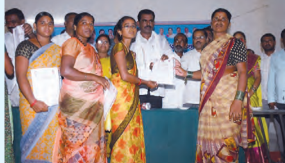
ఇందిరమ్మ ఇళ్ల ప్రాసీడింగ్స్ అందజేసిన ఎమ్మెల్యే