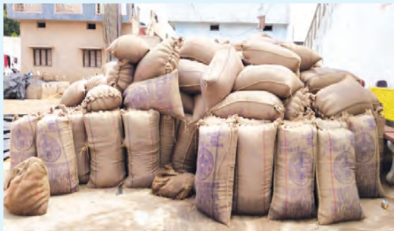
వర్షానికి తడిసిన ధాన్యపు బస్తాలు

నవాబుపేట, జూన్ 12 ప్రభాతవార్త : రైతులు ఆరుగాలం పండించిన పంటను ప్రభుత్వ అధికారులకు ఐతే అధికారులకు విక్రయించే క్రమంలో ధాన్యం విక్రయాలకు అడుగుపెట్టినా ఆటంకాలు ఏర్పడుతున్నాయి. బోక్సన్ జారీలో, గన్నీ బ్యాగుల సరఫరాలో, తూకాలు వేయడంలో, లాభిల సరఫరాలో, ధాన్యం రవాణాలో పూర్తి నిర్లక్ష్యంగా వ్యవహరిస్తున్నారని ఈ జాప్యం వల్ల మధ్యాహ్నం జోరుగా కురిసిన వర్షం వల్ల సంచుల్లో ఎత్తైన ధాన్యం బస్తాలను లాభిలో లోక్ చేయడంలో నిర్లక్ష్యం వహించిన ఐతే అధికారుల వల్ల రైతులు తడిసిన ధాన్యం బస్తాలతో బోరుమంటున్నారు. గురువారం మండల పరిధిలోని దొడ్డిపల్లి గ్రామంలో రైతులు పండించిన పరి ధాన్యాన్ని గన్నీ బ్యాగుల్లో నింపిన ధాన్యాన్ని లాభిలో లోక్ చేయడానికి నిర్లక్ష్యం వహించడం కారణంగా ధాన్యం బస్తాలు తడిసి ముద్దయ్యాయి. దీంతో రైతాంగం ఐతే అధికారులపై గురుగా ఉన్నారు. అధికారులు గమనించి సకాలంలో గన్నీ బ్యాగుల విషయంలో కానీ లాభిల సరఫరా విషయంలో గాని ముందు జాగ్రత్తగా వ్యవహరించి రైతులను ఆదుకోవాలని రైతులు వాపోతున్నారు.