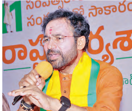
హైదరాబాద్ లో ఆదివారం జరిగిన పదాధికారుల సమావేశంలో కేంద్ర మంత్రి కిషన్ రెడ్డి

హైదరాబాద్, జూన్ 1 ప్రభాతవార్త: ప్రపంచ మొత్తం సరేంద్ర మోడీ పాలనపై విశ్వాసం, నమ్మకాన్ని వ్యక్తం చేస్తున్నారని కేంద్ర బోగ్గ, గనుల శాఖ మంత్రి, బీజెపి రాష్ట్ర అధ్యక్షుడు జి.కిషన్ రెడ్డి అన్నారు. 11 ఏళ్ల పాలనలో ఒక్కరూపాయి అవినీతి లేకుండా కొనసాగించారన్నారు. యూపిఏ హయాం అంతా కుభకోణాల ముయ్యె అని ఆరోపించారు. జీరో టాలరెన్స్ విధానంతో నీతివంతమైన పాలనను ప్రధాని మోడీ దేశానికి అందించారన్నారు. ఆదివారం నాంచల్లోని బీజెపి ప్రధాన కార్యాలయంలో జరిగిన పదాధికారుల సమావేశం అనంతరం విలేజుల సమావేశంలో ప్రసంగించారు. మోడీ వందకోట్ల పాలనపై వివరాలను ప్రతి ఇంటికి, గ్రామాలలోని ప్రజలకు అందించాల్సిన అవసరం ఉందని కిషన్ రెడ్డి స్పష్టం చేశారు. కాంగ్రెస్ హయాంలో కేంద్రం 32 శాతం నిధులను ఇచ్చేవారు. ప్రస్తుతం 42 శాతానికి పెంచి రాష్ట్రాలు ఆర్థిక పరిస్థితులు సాధించాలని విశ్వాసం, నమ్మకం, కమిటీలతో కొనసాగిన న్నాస్తున్నారు. జిఎస్ టీ ద్వారా అవినీతి లేకుండా సమర్థవంతమైన పనులు విధానాన్ని రూపొందించారు. దేశంలో హైదరాబాద్ లో సహజ ఉగ్రవాద దాడులు జరిగేవన్నారు. గత 11 ఏళ్లలో ఒక్క ఉగ్రవాద దాడులు జరిగేవన్నారు. కాంగ్రెస్ హయాంలో ఉగ్రదాడుల్లో పౌరులు, స్త్రీలు మరణించిన వారి సంఖ్య 42వేల మంది మృతి చెందారని ఆవేదన వ్యక్తం చేశారు. దేశంలో నూతన రైళ్లు, 1300 రైల్వే స్టేషన్లు ఏకకాలంలో అధునీకరిస్తున్న ఘనత బీజెపి, ఎన్ డి, ప్రధాని మోడీకి దక్కతుందన్నారు. తెలంగాణలో కూడా బీజెపిని విమర్శిస్తున్న వారు 40 స్టేషన్లు ఏకకాలంలో >>2