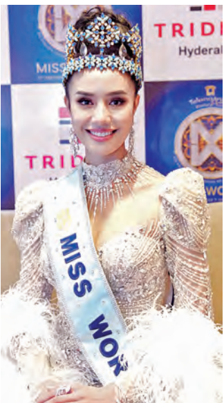
ఆదివారం హైదరాబాద్ లో మీడియాతో మిస్ వరల్డ్ ఓపల్ సుచాతా

హైదరాబాద్ ఓ మధుర జ్యుస్ కం.. తెలంగాణ ఆతిథ్యం మరువలేను 'కీరీటం'తో బాధ్యత పెరిగింది 'ప్రపంచ సుందరి' ఓపల్ సుచాతా