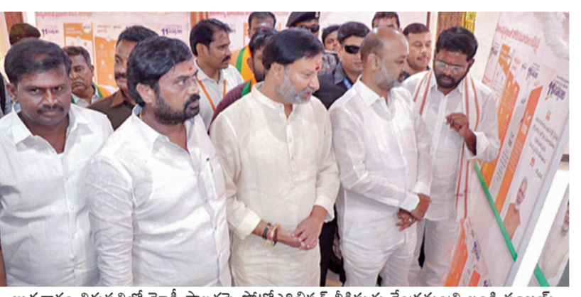
బుధవారం తిరుపతిలో మోడీ పాలనపై ఘోషోచ్ఛిషిషన్ వీక్షిస్తున్న కేంద్రమంత్రి బండి సంజయ్

• కేంద్ర ప్రభుత్వ పథకాలతో కోట్లాదిమంది పేదలకు లబ్ధి • రాష్ట్రానికి కేంద్రం నుంచి పూర్తి సహకారం • నాటికత్తికి మరింత ప్రోత్సాహం: కేంద్రమంత్రి బండి సంజయ్