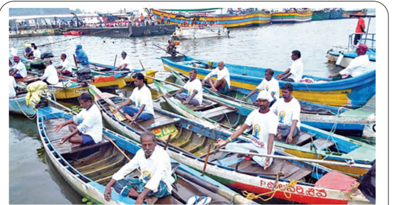
బుధవారం విజయవాడలో కృష్ణానది పడవలపై యోగాసనాలు చేస్తున్న అభ్యాసకులు

కూటమి పాలనకు యేడాది పూర్తి నేడు భారీ బహిష్కరణ సభ విజయవాడ జూన్ 11 ప్రభాతవార్త ప్రతినిధి: ఆంధ్రప్రదేశ్ రాష్ట్రంలో ఎన్డీయే కూటమి సర్కార్ ఏడాది రేపటికి ఏడాది పూర్తి అవుతుంది. స్వపరిపాలన స్వర్ణాంశ ప్రజాకే పేరుతో అమరావతిలో రాష్ట్ర స్థాయి సభ ఏర్పాటుకు సన్నాహాలు కొనసాగుతున్నాయి. అమరావతిలో రేపు సాయంత్రం 5 గంటలకు భారీ బహిష్కరణ సభకు ప్లాన్ చేస్తున్నారు. ఎపి సచివాలయం వెనక సభ ఏర్పాట్లు చేస్తున్నారు అధికారులు. ఈ కార్యక్రమానికి ముఖ్యమంత్రి చంద్రబాబునాయుడు, డిప్యూటీ సీఎం పవన్ కల్యాణ్, ఇతర మంత్రులు, ఎమ్మెల్యేలు, ఎమ్మెల్సీలు ఎంపీలు హాజరుకానున్నారు. అయితే కూటమి ప్రభుత్వం అధికారంలోకి వచ్చి ఏడాది అవుతున్న సందర్భంగా ఆర్థిక శాఖల అధికారులు, ఉద్యోగులు తప్పకుండా హాజరు కావాలని రాష్ట్ర సర్కార్ ఆదేశాలు జారీ చేసింది. ఏడాది పాలనలో ప్రభుత్వం సాధించిన ప్రగతిపై సీఎం చంద్రబాబు డిప్యూటీ సీఎం పవన్ కల్యాణ్ ప్రసంగాలు చేయనున్నారు. మరోవైపు, సభ జరిగే ప్రాంతంలో రాత్రి భారీ వర్షం కురిసింది. ఈ నేపథ్యంలో సభా ప్రాంగణం పూర్తిగా తడిసి పోయింది. దీంతో వేదిక మార్చాలా సచివాలయం వెనక ప్రాంతంలోనే సభా ఏర్పాట్లు చేయాలా అనే ఆలోచనలో అధికారులు ఉన్నారు.