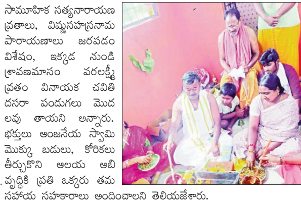
సామూహిక సత్యనారాయణ ప్రతాలు, విష్ణుసహస్రనామ పారాయణాలు జరపడం విశేషం, ఇక్కడ నుండి శ్రావణమాసం వరలక్ష్మీ ప్రతం వినాయక చవితి దసరా పండుగలు మొదలవు తాయని అన్నారు. భక్తులు ఆంజనేయ స్వామి మొక్కు బదులు, కోరికలు తీర్చుకొని ఆలయ అభివృద్ధికి ప్రతి ఒక్కరు తమ సహాయ సహకారాలు అందించాలని తెలియజేశారు.