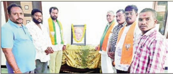
హుజూర్ నగర్ టౌన్ జూలై 6 ప్రభాతవార్త