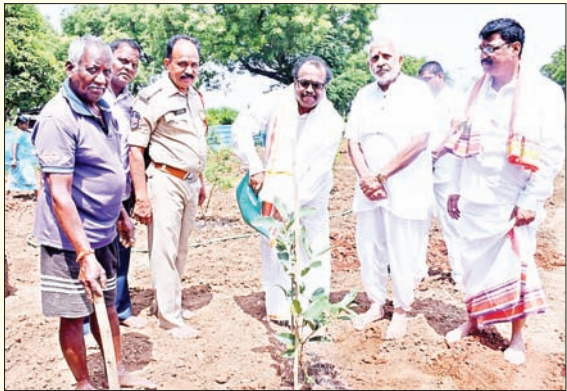
పదివేల మొక్కలు నాటుతాం (మొదటి పేజీ తరువాయి..)

అప్పగించారు. ఇప్పటివరకు 41,400 మెట్రిక్ టన్నుల బియ్యం అప్పగించారు. ఇంకా 1,37,884 బియ్యం ఇవ్వాలి ఉంది. ఇది ఇలా ఉండగా 202425 యాసంగి సీజన్ కు సంబంధించి సిఎంఆర్ ధాన్యం నిల్వలు సక్రమంగా ఉన్నట్లు అధికారులు అంటున్నారు. కానీ వానాకాలం సిఎంఆర్ బియ్యం సేకరణ పూర్తికాలేదు. దీంతో మిల్లర్లపై అధికారులు ఒత్తిడి తెస్తున్నారు. వానాకాలం సిఎంఆర్ సేకరణలో బకాయిలు ఎక్కువగా సూర్యాపేట జిల్లాలోని ఉన్నట్లు తెలుస్తుంది. యాసంగి సీజన్ సేకరణ ఇప్పుడే ప్రారంభమైంది. ఇందులో నల్లగొండ జిల్లాలో 19 శాతం యాదాద్రి భువనగిరి జిల్లాలో 12 శాతం సూర్యాపేట జిల్లాలో కేవలము రెండు శాతం మాత్రమే జూన్ చివరి నాటికి సేకరణ జరిగింది. సేకరణపై అధికారులు దృష్టి సారించారు. యాసంగి సీజన్లో ధాన్యం దిగుబడి ఎక్కువగా వచ్చింది. మిల్లర్లకు ధాన్యం కేటాయింపులు జరిగాయి. ఈ నేపథ్యంలో ధాన్యం నిల్వలో సక్రమంగా ఉండటమే కాకుండా బియ్యం సేకరణ సైతం అధికంగా జరిగేందుకు అధికారులు జాగ్రత్తలు తీసుకుంటున్నారు. మిల్లర్లకు తగిన సూచనలు సలహాలు ఇస్తున్నారు. తనిఖీలు కూడా చివరి అంకానికి చేరాయి. నివేదికలను తయారుచేసి ఉన్నత అధికారులకు పంపేందుకు చర్యలు తీసుకుంటున్నారు. ఒకటి రెండు రోజుల్లో తనిఖీలు ముగియనున్నాయి. ధాన్యం పక్కదారి పట్టకుండా అధికారులు చర్యలు తీసుకుంటున్నారు.