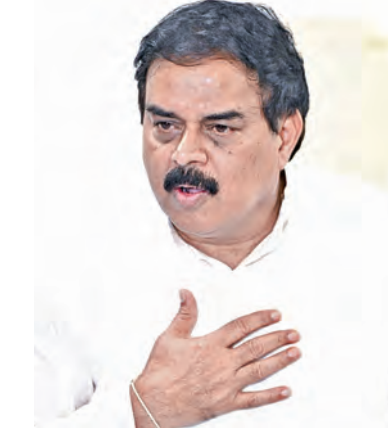
31 ఆక్టోబర్ 2024 సంవత్సరంలో దీపావళి రోజున శ్రీకాకుళం జిల్లాలో సిఎం చంద్రబాబు నాయుడు చేతుల మీదుగా దీపం 2 పథకాన్ని ప్రారంభించడం జరిగిందన్నారు. మొదటి విడతలో 97 లక్షల మందికి ఉచిత గ్యాస్ అందించాం అన్నారు. ఇందుకు గాను కూటమి ప్రభుత్వం 846 కోట్లు విడుదల చేసిందన్నారు. రెండవ విడత 91.10 లక్షల మందికి ఉచిత గ్యాస్ అందించాం. ఇందుకు గాను కూటమి ప్రభుత్వం 712 కోట్లు ఖర్చు చేసిందన్నారు. జగన్ పాలనలో

గుంటూరు, జూలై 16 ప్రభాతవార్త ప్రతినిధి : మాజీ సిఎం వైఎస్ జగన్ అవగాహన, బాధ్యత లేకుండా మాట్లాడుతున్నారని, రైతుల కోసం మీరు చేసింది ఏంటో చర్చకు సిద్ధమా? అని మంత్రి నాదెండ్ల మహేశ్వర్ ప్రశ్నించారు. కాసురూ సివిల్ సర్వే భవన్ లో ఏర్పాటు చేసిన మీడియా సమావేశంలో ఆంధ్రప్రదేశ్ రాష్ట్ర వినియోగదారుల వ్యవహారాలు, ఆహార మరియు పౌర సరఫరాల శాఖ మంత్రి నాదెండ్ల మహేశ్వర్ మాట్లాడుతూ మాజీ సిఎం జగన్ అబద్ధాల ప్రచారం చేస్తున్నారన్నారు... ఆయన మాట్లాడిన మాటలకు ఇది విపరీతం గాని ఎదురు దాడి కావచ్చు... ప్రజల తీర్పును అర్థం చేసుకోవాలని హితవు పలికారు. ఈ ప్రభుత్వం ఐదేళ్లు కాలంలో గుంటూరు కూడా పూర్ణచేసి జగన్ ఈరోజు కూటమి పాలన గురించి మాట్లాడటం విచిత్రంగా ఉందన్నారు. మధ్యపాన సిపేడర్లు, అమ్మబడి అని మీరిచ్చిన హామీ ఎప్పుడు ప్రాబంధించారు. ఎందుకు అమలు చేయలేదని ప్రశ్నించారు. ప్రో డెవలప్మెంట్, ప్రో వెల్ఫేర్ చేయాలని ప్రజలు కూటమి ప్రభుత్వాన్ని గెలిపించారు. అభివృద్ధి చేస్తారని ప్రజలు మాకు అధికారం ఇచ్చారు... మీరేం ఎక్కడ బయట లు కొప్పుతారని కాసు అన్నారు. దీపం 2 పథకంలో ఉచిత గ్యాస్ సిలిండర్ లను నాలుగు నెలలకోసారి అందిస్తున్నామన్నారు.