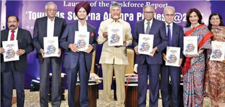
బుధవారం న్యూఢిల్లీలో టాన్స్ ఫార్మ్ నివేదిక స్వచ్ఛంద ప్రదేశ్-2047ను ఆవిష్కరిస్తున్న సీఎం చంద్రబాబు

17-7-2025 గురువారం సంపుటి: 31 సంఠి: 166 పేజీలు: 12 వెల: 6.50