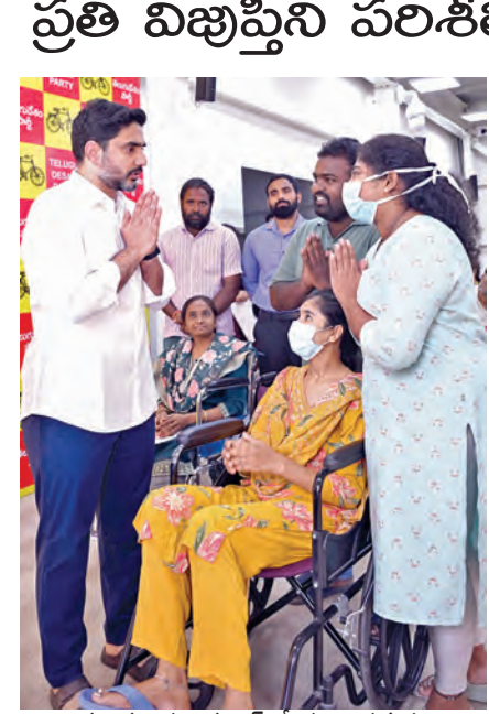
బుధవారం ప్రజాదర్శాల్లో ప్రజల సమస్యలు వింటున్న మంత్రి లోకేష్

'ప్రజాదర్శాల్'లో మంత్రి లోకేష్ ప్రతి విజుప్తిని పరిశీలిస్తున్నానని వెల్లడి