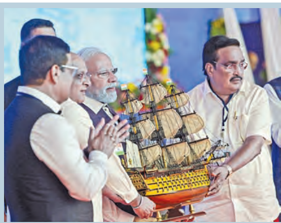
గుజరాత్ లోని ఛావ్ నగర్ లో పలు అభివృద్ధి ప్రాజెక్టుల ప్రారంభోత్సవం అనంతరం ప్రధాని మోడీకి జియోపీకను అండ్ జేస్సెన్స్ కేంద్ర మంత్రి సిఆర్ పాటిల్, సిఎం భూపేంద్ర భాయ్ పట్లే