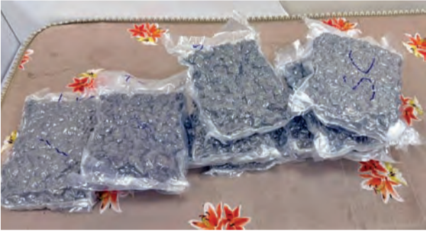
ఎయిర్పోర్టులో పట్టుబడిన హైడ్రోపోనిక్ గంజాయి ప్యాకెట్లు

రూ. 12 కోట్లు విలువ చేసే 12 కిలోల హైడ్రోపోనిక్ గంజాయి పట్టివేత. రంగారెడ్డి జిల్లా సెప్టెంబరు 20, ప్రభాతవార్త: భారీగా హైడ్రోపోనిక్ కలుపు మొక్కల పదార్థాలను పట్టుకున్న సంఘటన శంషాబాద్ ఎయిర్ పోర్టు లో చోటుచేసుకుంది. పక్కా సమాచారంతో డిఆర్ఐ అధికారులు శంషాబాద్