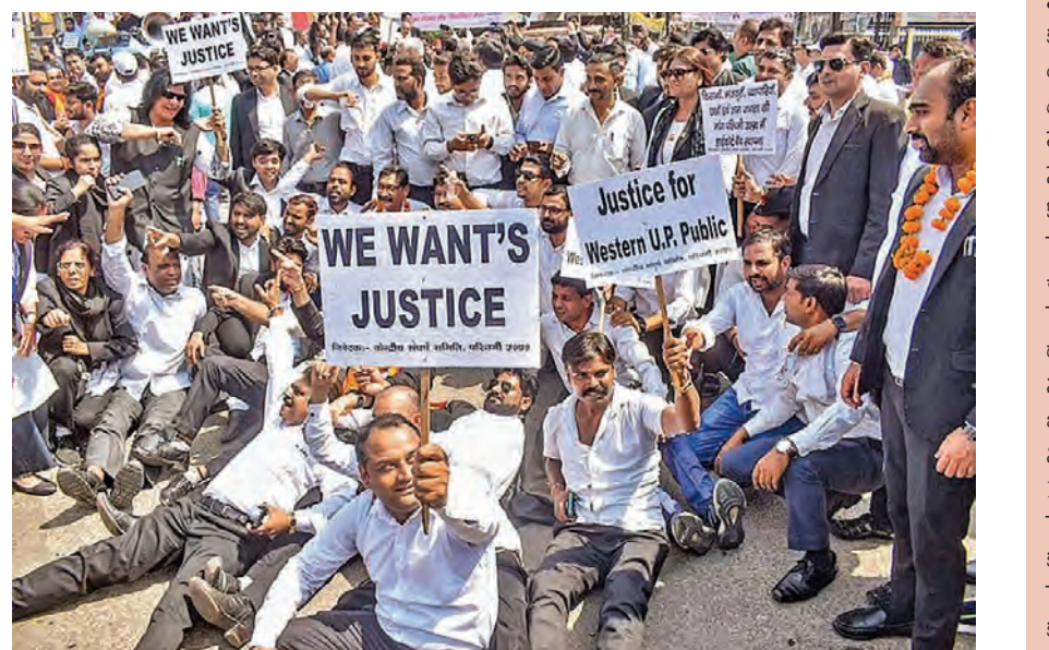
యుపిలోని మీరట్ లో హైకోర్టు బెంచ్ ఏర్పాటు చేయాలని శనివారం ఆందోళన చేస్తున్న న్యాయవాదులు