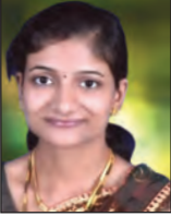
कृति आरके जैन

इसे हल्की मौज समझते थे, लेकिन सच यह है कि यहीं महिलाएं एकजुट होकर अपनी आवाज मजबूत करती हैं और समाज को नई राह दिखाती हैं। हमारे देश में, जहां औरतों को अक्सर घर की चारदीवारी में बांध दिया जाता है, किटी पार्टी एक आजादी का दरवाजा खोलती है। यहां वे फैशन या मस्ती से आगे बढ़कर पैसे की ताकत सीखती हैं, सामाजिक मुद्दों पर बोलना शुरू करती हैं और नेतृत्व की कमान संभालती हैं। यह बदलाव कोई संयोग नहीं—यह महिलाओं का सोचा-समझा, एकजुट कदम है, जो उन्हें समाज की असली ताकत बना रहा है।