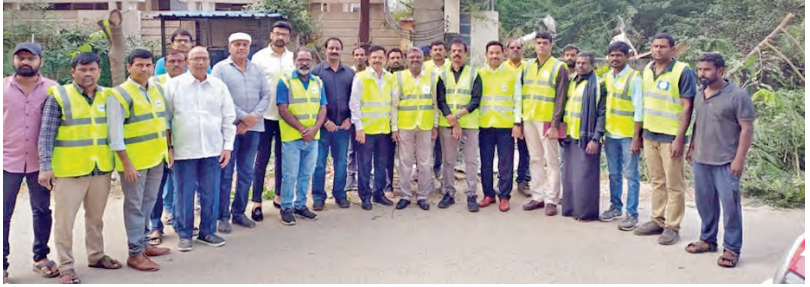
మణికొండలో జరిగిన ప్రజాభివృద్ధి కార్యక్రమంలో పాల్గొన్న విద్యుత్ శాఖ అధికారులు, విద్య కాలనీ ప్రతినిధుల దృష్టం.