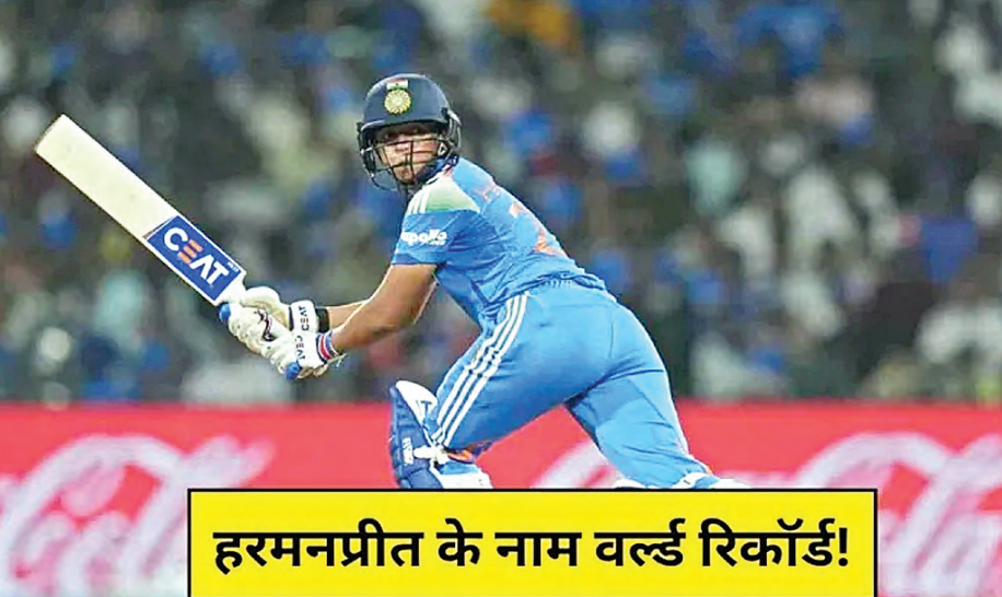
हरमनप्रीत के नाम वर्ल्ड रिकॉर्ड!

मुंबई, 3 नवंबर (एजेंसियां)। महिला वनडे वर्ल्ड कप 2025 के फाइनल मुकाबले में टीम इंडिया की भिड़ंत साउथ अफ्रीका के साथ हो रही है. टॉस गंवाने के बाद पहले बल्लेबाजी करने उतरी भारतीय टीम मजबूत स्थिति में दिखाई दे रही है. हालांकि, कप्तान हरमनप्रीत कौर खिताबी मैच में बल्ले से कुछ खास कमाल नहीं दिखा सकीं और वह सिर्फ 20 रन बनाकर आउट हुईं. मगर इंडियन कैप्टन ने अपनी इस छोटी इनिंग के साथ ही विश्व कप में वर्ल्ड रिकॉर्ड को अपने नाम कर डाला है. हरमन ने बेलिंडा क्लार्क के बड़े रिकॉर्ड को चकनाचूर कर दिया है. हरमनप्रीत ने किया कमाल दरअसल, हरमनप्रीत कौर महिला वनडे वर्ल्ड कप के नॉकआउट मैचों में सबसे ज्यादा