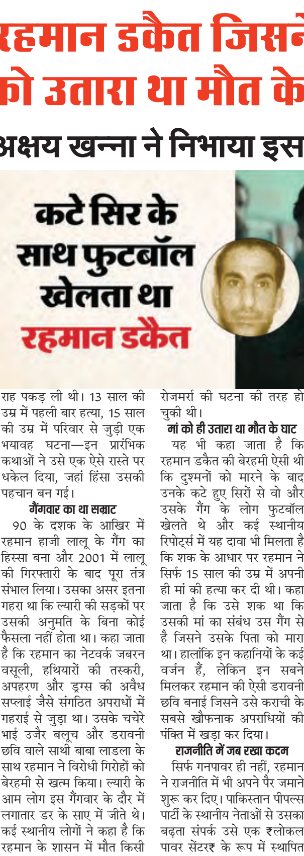
रह पकड़ ली थी। 13 साल की उम्र में पहली बार हत्या, 15 साल की उम्र में परिवार से जुड़ी एक भयावह घटना—इन प्रारंभिक कथाओं ने उसे एक ऐसे रास्ते पर धकेल दिया, जहां हिंसा उसकी पहचान बन गई।