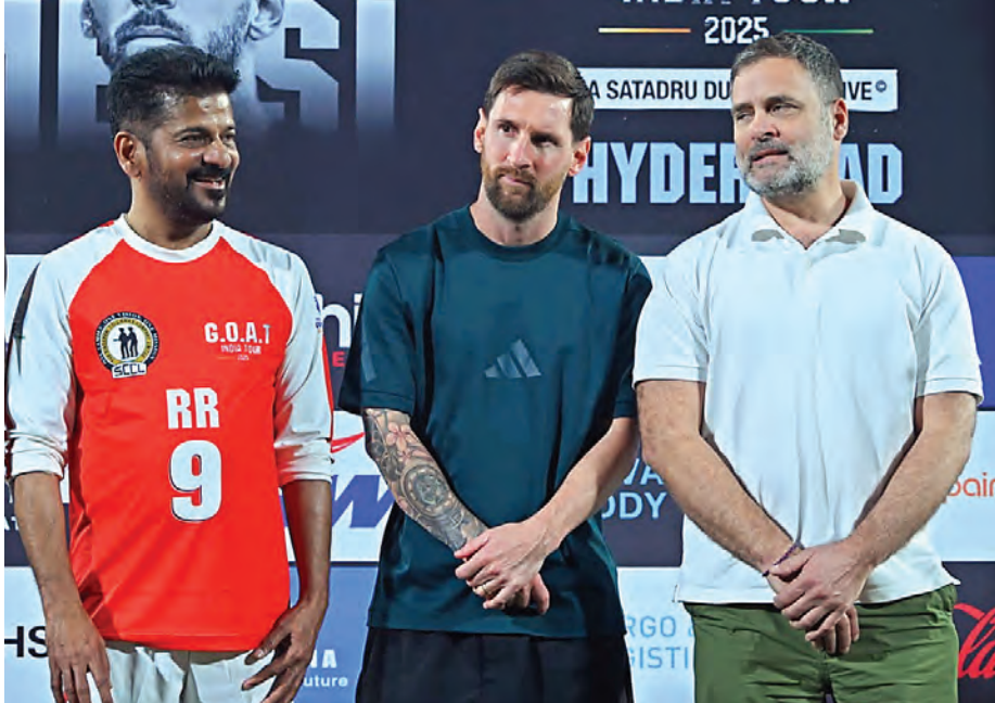
तेलंगाना के मुख्यमंत्री रेवंत रेड्डी और लोकसभा में विपक्ष के नेता राहुल गांधी भी मेसी के साथ मैदान पर

सीएम रेवंत के साथ एक्जीबिशन मैच में लिया हिस्सा