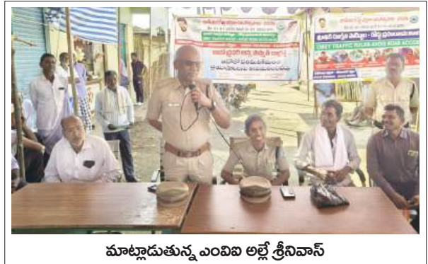
మాట్లాడుతున్న ఎంపి అల్లే శ్రీనివాస్