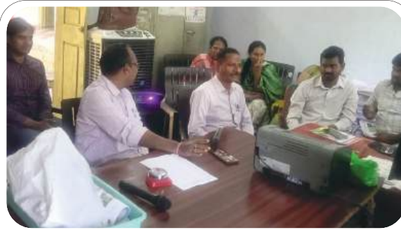
కార్యదర్శులతో ఎంపీడిఓ సమావేశం

అందరూ తప్పనిసరిగా హాజరయ్యేలా చర్యలు తీసుకోవాలని ఆదేశించారు. అవసరమైన గ్రామ పంచాయతీల్లో వీడియోలను నిర్మాణానికి తీర్మానాలు సమర్పించాలని, గ్రామ పంచాయతీ సర్పర్లలో బ్యాగ్ ఫిల్లింగ్ పూర్తిచేసి విత్తనాలు