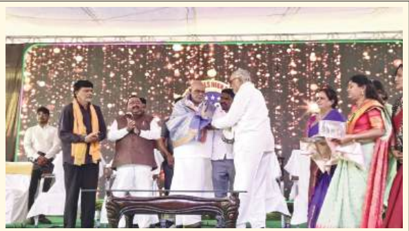
వార్షికోత్సవ సందర్భంగా పాఠశాలలో పాల్గొన్న ఎమ్మెల్యే చిత్రం