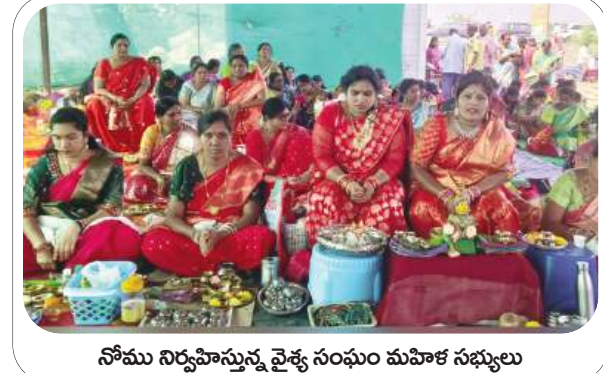
నోము నిర్వహిస్తున్న వైశ్య సంఘం మహిళా సభ్యులు