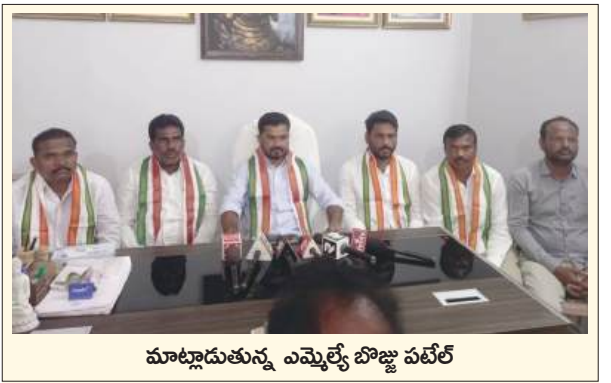
మాట్లాడుతున్న ఎమ్మెల్యే బొజ్జ పటేల్