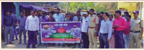
ర్యాలీలో పాల్గొన్న అధికారులు, విద్యార్థులు