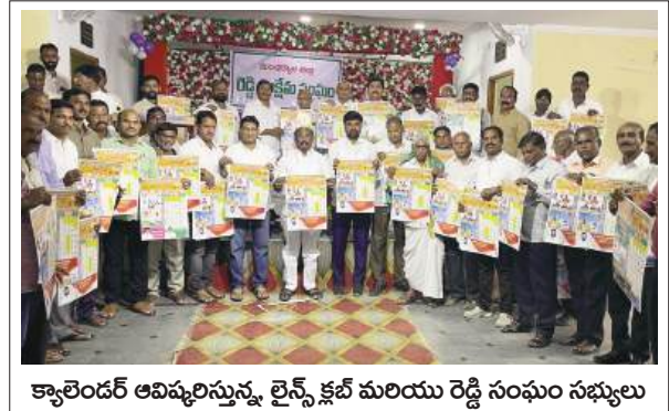
క్యాలెండర్ ఆవిష్కరణను, లైన్స్ క్లబ్ మరియు రెడ్డి సంఘం సభ్యులు