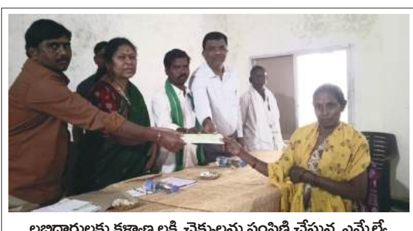
లబ్ధిదారులకు కళ్యాణ లక్ష్మి చెక్కులను పంపిణీ చేస్తున్న ఎమ్మెల్యే

మందమర్రెలోని 132/33 కేవీ సబ్ స్టేషన్ మరమ్మతుల కారణంగా శ్రీరాంపూర్ ఏరియా పరిధిలోని అన్ని కాలనీలకు ఆదివారం విద్యుత్ సరఫరా నిలిపివేస్తున్నట్లు ఏరియా డిజిఎం (పర్సనల్) అనిల్ కుమార్ ఒక ప్రకటనలో తెలిపారు. ఉదయం 9 గంటల నుండి మధ్యాహ్నం 3 గంటల వరకు ఈ అంతరాయం ఉంటుందని పేర్కొన్నారు. సబ్ స్టేషన్ నిర్వహణ పనుల దృష్ట్యా విద్యుత్ కోత ఉంటుందని అన్నారు. ఈ అంతరాయాన్ని దృష్టిలో ఉంచుకుని శ్రీరాంపూర్ ఏరియాలోని కార్మికులు, అధికారులు, నివాసితులు సహకరించాలని కోరారు.