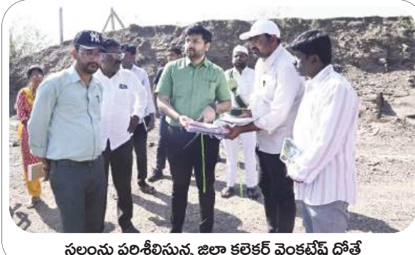
స్థలంను పరిశీలిస్తున్న జిల్లా కలెక్టర్ వెంకటేష్ ధోత్రే

యంగ్ ఇండియా ఇంటిగ్రేటెడ్ గురుకుల పాఠశాల నిర్మాణ స్థలాన్ని పరిశీలించడం జరిగిందని జిల్లా కలెక్టర్ వెంకటేష్ ధోత్రే అన్నారు. శనివారం జిల్లాలోని వాంకిడి మండలం బెండార గ్రామంలో ప్రభుత్వ స్థలాన్ని యంగ్ ఇండియా ఇంటిగ్రేటెడ్ గురుకుల పాఠశాల నిర్మాణం కొరకు పరిశీలించడం జరిగిందని తెలిపారు. ఈ సందర్భంగా జిల్లా కలెక్టర్ మాట్లాడుతూ ప్రభుత్వం ప్రతిష్ఠాత్మకంగా నియోజకవర్గానికి 200 కోట్ల రూపాయల అంచనా వ్యయంతో ఒక యంగ్ ఇండియా ఇంటిగ్రేటెడ్ గురుకుల పాఠశాల నిర్మాణానికి చర్యలు చేపడుతుందని తెలిపారు. గురుకులంలో విశాలమైన గదులు, పాఠశాల భవనాలు, క్రీడాస్థలం ఏర్పాటుకు సుమారు 25 ఎకరాల ప్రభుత్వ భూమి అవసరం ఉంటుందని, సర్వే అధికారులు,