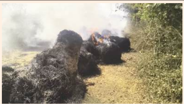
విద్యుత్ ఘాతంతో దగ్ధమైన గడ్డి కట్టలు