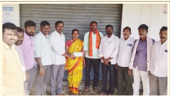
చెక్కును అందజేస్తున్న జిజిపి నాయకులు