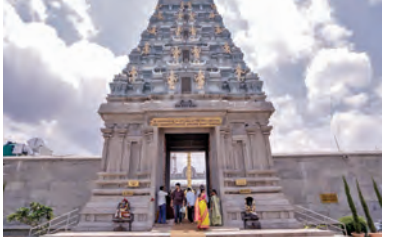
ఫిబ్రవరి 17 నుండి జూబ్లీహిల్స్ వేంకటేశ్వరస్వామి ఆలయంలో బ్రహ్మోత్సవాలు

ప్రత్యామ్నాయం-తిరుమల: "అన్నం పరమార్జునమరణం" భావిస్తూ ఏడుకొండ వేంకటేశ్వరస్వామి దర్శనార్థం చేస్తున్న లక్షలాదిమంది భక్తులకు ఆశీ అనేది తెలియకుండా రుచిగా, శుచిగా తిరుమల తిరుపతి దేవస్థానం అన్నప్రసాదాలు అందించారు. రోజూవారాలు 6.10 అక్షయమంది నుండి 2.25 అక్షయమంది వరకు భక్తులు అన్నప్రసాదాలు స్వీకరిస్తుండటం విశేషం. భక్తుల రద్దీ తో ఇప్పుడు తగ్గిందే వెంగమాంబ అన్నప్రసాదం భవనంలో మధ్యాహ్నం 1.45లో అన్నప్రసాదాలు భక్తులకు వడ్డిస్తున్నారు. ఇప్పటికే వెంగమాంబ భవనంలో మధ్యాహ్నం వేళ భక్తులు నిరీక్షణ సమయం ఎక్కువగా ఉంది. ఈ సేవలలో ప్రత్యామ్నాయంగా మూడో అన్నప్రసాద భవనం కోసం టిడిపి అధికారులు వెతుకుతూ ప్రారంభించారు. ఈ భవనాన్ని భక్తులకు సౌకర్యంగా, రద్దీపై ప్రాంతంలో ఏర్పాటుచేయాలని ఆలోచన చేస్తున్నారు. అన్నప్రసాదంలో అదనంగా మసాలాపదం అందిస్తుండటం, అన్నప్రసాదాల నాణ్యత వందశాతం మెరుగుపడటంతో ధనవంతులైన భక్తులు నుండి సమాఖ్యభక్తుల వరకు అన్నప్రసాదాలను దేవుని ప్రసాదంగా భావించి స్వీకరిస్తున్నారు. ఏకదాటిగా జీవితం రథసప్తమి చర్యలను 9 అక్షయమందికి భక్తులుపైగా 14 రకాల అన్నప్రసాదాలు స్వీకరించడం రికార్డుని నెలకొల్పింది. మరీ రోజూకోసా రద్దీ మెరుగుతున్న వేళ మరో అన్నప్రసాద భవనం ఏర్పాటుపై భక్తులకు సౌకర్యంగా ప్రాంతాన్ని ఎంపికచేయాలని టిడిపి అధికారులు ఆలోచన చేస్తున్నారు. తిరుమలలో నిరంతరాయంగా ఉదయం 8.30 గంటల నుండి రాత్రి 11 గంటల వరకు వెంగమాంబ అన్నప్రసాదం భవనంలో నాణ్యమైన అన్నప్రసాదాలు సాంభారం, రం, మజ్జిగ, పక్కెరపొంగి, తాళిపప్పు(కేసీ), నిసాలపద రుచికరమైన వడ్డిస్తున్న విషయం తెలిసింది. రోజూవారాలు తిరుమలకు లక్షమందివరకు భక్తులు చేరుకుంటూ 80 వేలమంది భక్తులు దర్శించుకుంటున్నారు.