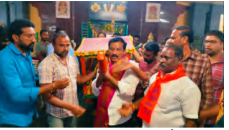
నరసాపురం జనవరి 29 ప్రభాతవార్త: పట్టణంలోని ఎర్రమల్లి వారి వీధిలో వేంచేసి ఉన్న యోగ నరసింహ స్వామి వారి ఆలయంలో భీష్మ ఏకాదశి సందర్భంగా భక్తులు పూజలు అభిషేకాలు నిర్వహించారు. స్వామివారి తీర్ధప్రసాదాలు స్వీకరించారు. స్వామివారి ఆత్మంత వైభవంగా అలంకరించి