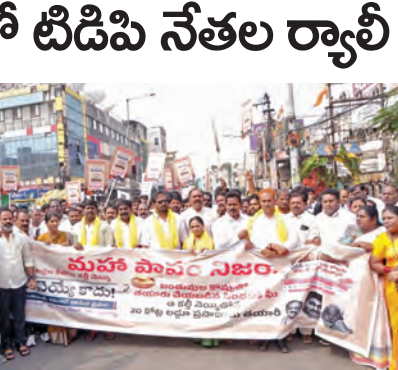
మహా పాపం - నిజం