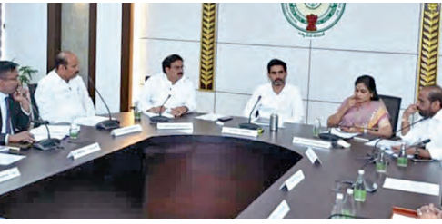
మంత్రివర్గ ఉపసంఘం సమావేశంలో విద్యాశాఖ మంత్రి నారా లోకేశ్

మలేషియాలో డి. జి. జి. డి. పాస్ పోస్టు నియంత్రణకు ప్రభుత్వం చేపట్టిన కఠిన చర్యలు సోషల్ మీడియాను దూరంగా ఉంచాల్సిందేనని ఆయన అన్నారు. రాష్ట్రంలో చూడగలిగిన అపరాధాలను అదుపు చేయడానికి సోషల్ మీడియాను దూరంగా ఉంచాల్సిందేనని ఆయన అన్నారు. రాష్ట్రంలో చూడగలిగిన అపరాధాలను అదుపు చేయడానికి సోషల్ మీడియాను దూరంగా ఉంచాల్సిందేనని ఆయన అన్నారు.