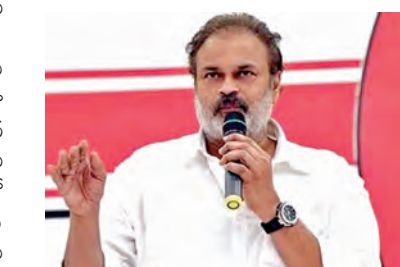
తాగుబోతులు, తిరుగుబోతులు అని పిచ్చిపిచ్చిగా మాట్లాడే అంబటి రాంబాబు లాంటి వాడిని రంగా బొమ్మ పక్కన రాంబాబు బొమ్మ పెట్టిన వైసీపీ నేతలను నేను కొన్ని ప్రశ్నలు అడుగుతున్నా..? 2024 ఎన్నికలలో ట్రెటర్ రాంబొమ్మను ప్రాంతాలలో కాపు, బలిజులు 20 శాతం వరకు ఉన్నా బక్క ఎంపీ సీటు ఇవ్వలేదు. 74 అసెంబ్లీ సీట్లలో ఒకే ఒక్క సీటు మాత్రమే కాపులకు ఇచ్చారు.