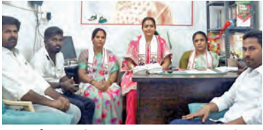
విలేజులలో కూర్చున్న జనసేన పార్టీ నాయకులు ఆరోగ్యకర, తదితరులు