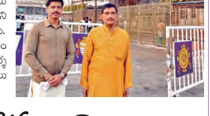
కలియుగప్రత్యక్షదైవం శ్రీవేంకటేశ్వరస్వామి ఆశీస్సులతో ప్రజలందరికీ శుభాలు కలగాలని విశ్రాంత డిజిటి ఆర్పి తాకూర్ కాండ్లించారు. వివిధ శ్రేణిలో ఆదివారం ఉదయం ఆలయంలోని చేరుకున్నారు. ఆలయం అధికారులు దర్శనం చేయించారు. స్వామి వారి తీర్థప్రసాద

తిరుమల, ఫిబ్రవరి 8 ప్రభాతవార్త ప్రతినిధి: కలియుగప్రత్యక్షదైవం శ్రీవేంకటేశ్వరస్వామి ఆశీస్సులతో ప్రజలందరికీ శుభాలు కలగాలని విశ్రాంత డిజిటి ఆర్పి తాకూర్ కాండ్లించారు. వివిధ శ్రేణిలో ఆదివారం ఉదయం ఆలయంలోని చేరుకున్నారు. ఆలయం అధికారులు దర్శనం చేయించారు. స్వామి వారి తీర్థప్రసాదాలు అందజేశారు.