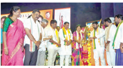
ఆయన చేసిన కీలక వ్యాఖ్యలు రాష్ట్ర రాజకీయాల్లో దుమారం రేపుతూన్నాయి. 1983లో అప్పట్లో ఎన్డీయే సీఎం జమ్మలమడుగు గజ్జల మల్లారెడ్డి ప్రభుత్వ పాలన కమ్మగా ఉందని చెప్పాడని గుర్తుచేశారు. జమ్మల రాష్ట్రంలో పరిస్థితి అలానే ఉందని, అందరికీ అర్థమై ఉంటుందని ఆయన చేసిన వ్యాఖ్యలు సభలో చర్చకు దారితీశాయి. పార్టీకేసం, ప్రభుత్వం కోసం గట్టిగా పనిచేసిన వారిని గుర్తింపు కట్టవలసిన వారికి పదవులు ఇవ్వాలని, అన్నికలూ వారికి న్యాయం చేయాలని ఆదినారాయణరెడ్డి వ్యాఖ్యలు సంవలనంగా మారాయి. కూటమి ప్రభుత్వం ఆయన వ్యాఖ్యలపై ఎలా స్పందిస్తుందో చూడాలి.