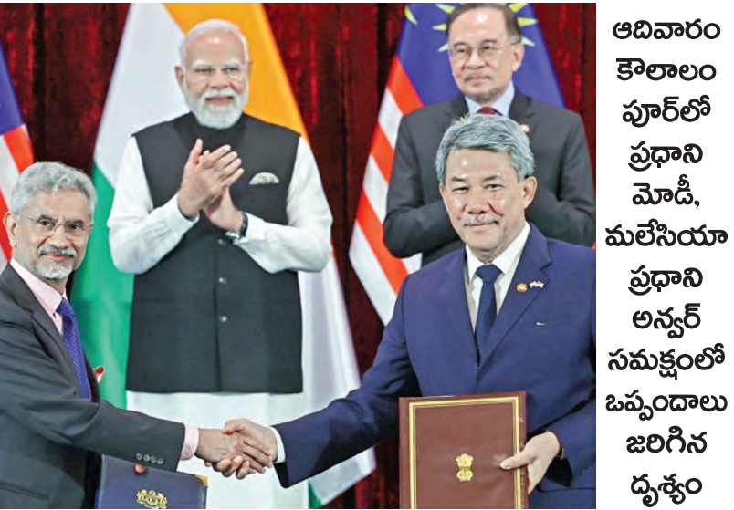
అధికారం క్రాంతిలో పూర్తిలో ప్రధాని మోడీ, మలేసియా ప్రధాని అన్వర్ సమక్షంలో ఒప్పందాలు జరిగిన దృశ్యం

>>> ఐదురాపాయలు నాణేలు ఉంచి బరువు తూకం వేస్తారు. భక్తుడు ఎంత బరువుంటే అంత సొమ్ము నగదు రూపంలో అక్కడ సిబ్బందికి అప్పగించి మొక్కలు తీర్చుకుంటారు. ఇలా చెల్లించిన నగదు గత ఐదేళ్లలో 2019-24 మధ్యకాలంలో నగం సొమ్ము దేవుని ఖజానాకు చేరలేదనేది బలమైన ఆరోపణలు. రోజుకు ఐదులక్షల నుండి 10లక్షల రూపాయల వరకు తులాధారంకావడం అందుతాయనేది టిటిడి వర్గాల సమాచారం . ఈ మొత్తాన్ని ఏగళాకారోజు దేవుని ఆదాయం లెక్కలో చూపాలి. అయితే గత ఐదేళ్లలో నగం ఆదాయం టిటిడికి జమకాలేదనేది గత ఏడాది మేనెలలోనే సంచలనం రేకెత్తించింది. ఈ ఉదంతంపై భానుప్రకాష్ డైరెక్టరు తులాధారం కానుకలు స్వాగతం చేశారంటూ ఆధారాలతో సహా ప్రభుత్వ విశ్లేషణనివ్వకొచ్చేమొట్టమొదటి విభాగంకు ఫిర్యాదు చేయడం మరింత బలం చేకూర్చింది. ఇంత భారీగా అవినీతి ఉంటే దేవుని సొమ్ము స్వాగతం చేసిన సూత్రధారులు, పాత్రధారులు ఎవరనేది పదినిలలగా తేల్చలేక పోతున్నారు. భక్తులు మొక్కబడుల్లో భాగంగా సమర్పించుకునే కానుకల్లో నిలువదోపిడీ మొక్కలు, తలసీలాల, కానినడక,తులాధారం అంటే ఎంతో ప్రీతి. భక్తులు తమ మొక్కలను తీర్చుకోవడానికి రోజువారీగా లక్షమంది