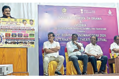
అందరూ అభినందించ విషయం అన్నారు. ఇందుకోసం ముఖ్యమంత్రి దృష్టికి నాటకరంగ సమస్యలను తీసుకెళ్లి, అకాడమీ బలోపేతానికి రూ.3 కోట్ల నిధులు అనుమతి సాధించాలని తెలిపారు. విద్యార్థులు చదువుతో పాటు కళలపై మక్కువ పెంచుకుంటే ఒత్తిడి లేని మేధస్సు వికాసంపై పరిశోధన చేశారు.

ప్రదర్శన రావాలని ఆయన కోరారు. రావాలని ఆయన కోరారు. నేషనల్ సర్కల్ ఆఫ్ డామా ద్వారా రాష్ట్రానికి ఓ వార్షిక తీసు కం రావాలన్న సురక్షితాలు సంతకాన్ని అందరూ అభినందించ విషయం అన్నారు. ఇందుకోసం ముఖ్యమంత్రి దృష్టికి నాటకరంగ సమస్యలను తీసుకెళ్లి, అకాడమీ బలోపేతానికి రూ.3 కోట్ల నిధులు అనుమతి సాధించాలని తెలిపారు. విద్యార్థులు చదువుతో పాటు కళలపై మక్కువ పెంచుకుంటే ఒత్తిడి లేని మేధస్సు వికాసంపై పరిశోధన చేశారు.