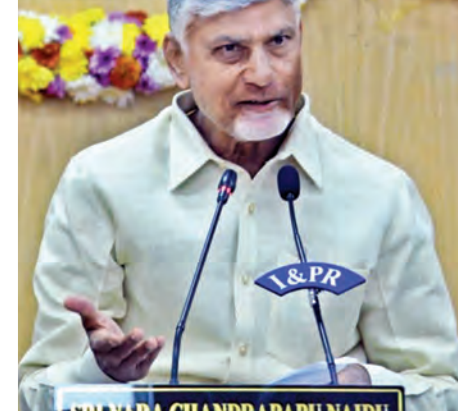
విజయవాడ, ఫిబ్రవరి 9, ప్రభాతవార్త ప్రతినిధి: అన్ని వర్గాల ప్రజలకు అభివృద్ధి, సంక్షేమం అందించుటకై రాష్ట్రం అభివృద్ధిని సాధించినట్లుగా భావించాలని ముఖ్యమంత్రి నారా చంద్రబాబు నాయుడు స్పష్టం చేశారు. ప్రజల జీవన ప్రమాణాలు మెరుగయ్యేలా ప్రభుత్వం ప్రణాళికలు సిద్ధం చేస్తోందని... వాటిని నిబద్ధతతో శ్రేణిస్తామి అమలు చేయాలని బాధ్యత అధికార యంత్రాంగంపై ఉంటుందన్నారు. సోమవారం రాష్ట్ర సచివాలయంలోని సీఎం చంద్రబాబు అధ్యక్షతన మంత్రులు, కార్యదర్శుల సమావేశం జరిగింది. ఈ సమావేశంలో జీఎస్ టీ పుద్దిరేలు, స్వర్ణారం 2047 విజన్ లక్ష్యాల్లో భాగంగా పది నూతన అమలు, ఆదాయాన్ని కాపాడు చర్చించారు. 202627లో కేంద్ర ప్రాయోజిత పథకాలకు సంబంధించిన కార్యాచరణపై దిశానిర్దేశం చేశారు. ఇక రియల్ టైమ్ గవర్నెన్సులో భాగంగా ఆవేర్, డేటా లెక్ సహా పాలనలో ఏపీ టూల్స్ ఇతర సాంకేతికత వినియోగంపై సమావేశంలో ప్రస్తావించారు. నైపుణ్యాభివృద్ధి, వన్ ఫ్యామిలీ వన్ ఎంప్లొమెంట్ యర్ విధానం అమలు, ఈజీ డాయ్ టిజినెస్ సహా రాష్ట్రంలో శాంతిభద్రతల అంతంపై సీఎం డిశా నిర్దేశం చేశారు. ఈ సమావేశానికి జిల్లా కలెక్టర్లు, ఎస్పీలు వచ్చుతుంటారు. ఈ సందర్భంగా ముఖ్యమంత్రిచంద్రబాబు మాట్లాడుతూ. ప్రభుత్వం చేపడుతున్న వివిధ కార్యక్రమాలను నెల వారీగా సమీక్షించుకోవాలి, శ్రేణిస్తామి వనర్లు బేరబా వేసుకోవాలి. ప్రతి నెలా 2 సార్లు కేబినెట్ సమావేశాలు, ఎన్ఎమ్ డి డ్వారా ప్రాజెక్టులకు ఆమోదం ఇస్తున్నాం. జిల్లా స్టాయిల్ కలెక్టర్లు, ఇంఫార్మ్ మంత్రులు కూడా అదే వేగంతో పనులు జరిగితే చాలా మంచి. గత 19 నెలల్లో

ప్రపంచంతో పోటీ పడాలంటే చట్టాలలో మార్పు రావాలి.. సంక్షేమంతోనే అసమానతల తగ్గుదల టెక్నాలజీతో మరిన్ని అవకాశాలు మంత్రులు, కార్యదర్శుల సమావేశంలో ముఖ్యమంత్రి చంద్రబాబు