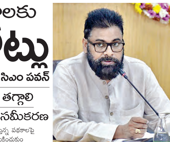
మంత్రులు, కార్యదర్శుల సమావేశంలో డి.సిఎం పవన్

విజయవాడ, ఫిబ్రవరి 9 ప్రభాతవార్త ప్రతినిధి: రాష్ట్రాభివృద్ధికి అనుకున్న లక్ష్యాలను నిర్దేశించుకున్న సమయానికి పూర్తయేలాంటి ఏపీ డివైలప్లీ సిఎం పవన్ కల్యాణ్ అధికారులకు సూచించారు. సోమవారం సచివాలయంలో సిఎం చంద్రబాబు అధ్యక్షతన నిర్వహించిన వివిధ శాఖల కార్యదర్శుల సమీక్షలో పవన్ కల్యాణ్ మాట్లాడుతూ శ్రేణిస్తామి అధికారుల ఉదాసీనతా వ్యవహారంపై పవన్ కల్యాణ్ సూచించారు. శ్రేణిస్తామి నుంచి పైస్తాయి అధికారి వరకు ఎవరికీ వారు సక్రమంగా బాధ్యతలు నిర్వహించాల్సిందేనన్నారు. తాము నాలుగు గోడల మధ్య కూర్చునే వ్యవస్థల కాదని, అంతా అభ్యుతంగా ఉండని చెబుతున్నాం. కొన్నిపట్ల గ్యాప్ ఉన్నాయని వ్యాఖ్యానించారు. అనుకున్న లక్ష్యాలను నిర్దేశించుకున్న సమయానికి పూర్తయేలాంటి స్పష్టం చేశారు. పోలీసులు అమలు చేయాలనే లక్ష్యంతో ముందుకెళ్తున్నామన్నారు. పల్లెపంచాయతీ రూ.2,500 కోట్లు, అడవిపత్తి బాటకు రూ.1,005 కోట్లు మంజూరు చేశామని చెప్పారు. వివిధ పథకాలకు రూ.11,328 కోట్లు మంజూరు అయ్యాయని తెలిపారు. జిల్లీవన్ మిషన్ రూ.25వేల కోట్ల మొదలిజేసిన చేశామన్నారు. ఇప్పటికే దాదాపు రూ.10వేల కోట్ల పనులు ప్రారంభమయ్యాయని డివైలప్లీ సిఎం పవన్ అన్నారు. రాష్ట్రాభివృద్ధి కోసం నిర్దేశించుకున్న లక్ష్యాలకు అనుగుణంగా పని చేయాలని మంత్రులు, కార్యదర్శుల సమావేశంలో ఉప ముఖ్యమంత్రి పవన్ కల్యాణ్ స్పష్టం చేశారు. ఎన్నికల్లో ఇచ్చిన హామీలు ప్రభుత్వం ఏర్పడ్డక అమలు