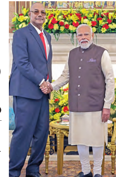
న్యూఢిల్లీలో సోమవారం ప్రధాని మోడీతో భేటీ అయిన సీషెల్స్ అధ్యక్షుడు హెల్మిన్

భారత్- సీషెల్స్ బంధం మరింత బలోపేతం ప్రధాని మోడీతో ఆ దేశ అధ్యక్షుడు హెల్మిన్ చర్చలు రక్షణ, ఆరోగ్యం, సముద్ర భద్రత తదితర అంశాలపై కీలక ఒప్పందాలు సీషెల్స్కు ఆర్థిక సాయం ప్రకటించిన మోడీ