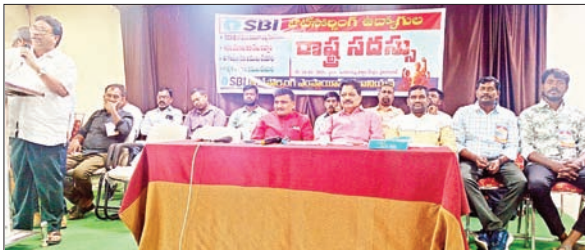
ఎజెస్సీలను తీసుకొచ్చి ఉన్న హక్కులను కూడా తీసుకోవే ప్రయత్నం చేస్తున్నారన్నారు. కాంట్రాక్ట్ లేబర్ చట్టం సెక్షన్ 25(బి), సుప్రీంకోర్టు తీర్పు ప్రకారం వీరందరికీ పర్మినెంట్ ఉద్యోగులకు ఇచ్చే వేతనాలు (సమాన పనికి సమాన వేతనం) చెల్లించాలన్నారు. ఏ రకంగా చూసినా వీరంతా చట్ట ప్రకారం పర్మినెంట్లు అర్హులే. వీరందరినీ పర్మినెంట్ చేయాలని డిమాండ్ చేశారు. డిమాండ్లు ఖాత్యోర్నింగ్, క్యాజువల్, టెంపరరీ ఉద్యోగులందరినీ పర్మినెంట్ చేయాలి. ఎజెస్సీలను రద్దు చేసి ఎస్సీల నేరుగా వేతనాలు చెల్లించాలి, దీని వలన ప్రతి ఎంప్లాయి మీద రూ.3 వేల నుండి 5 వేల వరకు నెలకు ఎస్.బి.ఐ.కి అదా అవుతాయి, నెలకు రూ 26,000 వేల వేతనం చెల్లించాలి, ఎనిమిది గంటల పనిదినం అమలు చేయాలి, గ్రాట్టుటీ అమలు చేయాలి, ఎస్సీల చెల్లిస్తున్న వేతనాలు మొత్తం ఎంప్లాయిస్కి చెల్లించాలి, పి.ఎఫ్, ఈ.ఎస్.ఐ సక్రమంగా జమ చేయాలి, వేతనాలు చెల్లించని, పిఎఫ్, ఈఎస్ఐ జమ చేయని ఎజెస్సీలను బ్లాక్ లిస్టో పెట్టాలి, ఆర్డీ కేంద్రంగా బిల్లులు చెల్లించాలి, ఎంప్లాయిస్ కి చెల్లిస్తున్న వేతనాలు, పిఎఫ్, ఈఎస్ఐలను ఎస్సీల అధికారులు చెక్ చేయాలని డిమాండ్ చేశారు. ఈ కార్యక్రమంలో సిబియూ ఏపీజీవీబీ రవికాంత్, భద్రాద్రి కొత్తగూడెం జిల్లా ఎస్సీల అవుట్సోర్సింగ్ ఎంప్లాయిస్ యూనియన్ నాయకులు క్రాంతి కుమార్, రామారావు, బ్యాంకు సిబ్బంది, పాల్గొన్నారు.