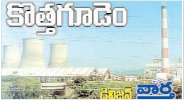
చుంచుపల్లి, జూలూరుపాడు, సుజాతనగర్