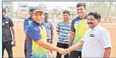
వార్త ఆర్ఎంతో కరవరణ చేస్తున్న ఏఎస్సీ

ఉల్లాసానికి క్రీడలు ఎంతగానో ఉపయోగపడతాయని చెప్పారు. ప్రస్తుత పోటీ ప్రపంచంలో పని ఒత్తిడిలో శారీరక వ్యాయామం తగ్గి మానసిక ఒత్తిడి విపరీతంగా పెరిగి అనేక దీర్ఘకాలిక రుగ్మతలకు గురవుతున్నామన్నారు.