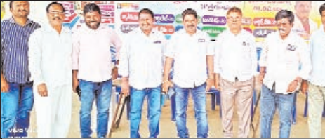
వార్త కుటుంబ సభ్యులతో ఆర్ఎం