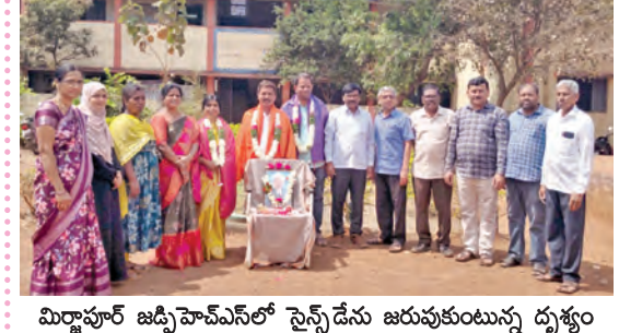
మిర్జాపూర్ జడ్చిపాచిలో సైన్స్ డేను జరుపుకుంటున్న దృశ్యం