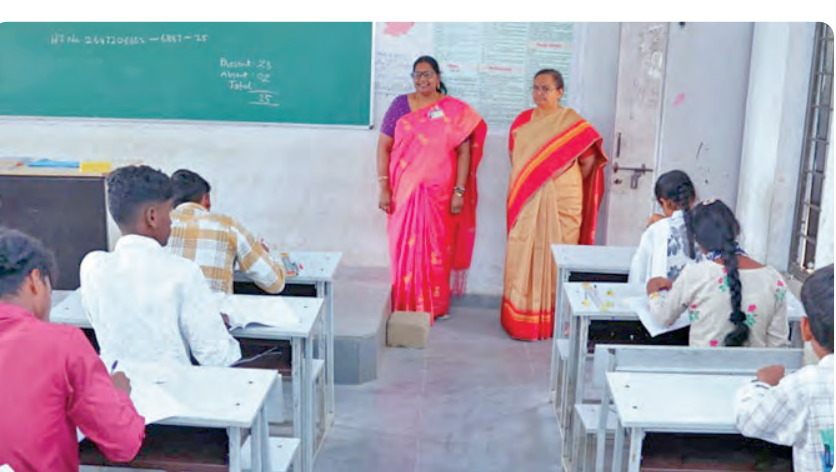
ఇంటర్మీడియట్ పరీక్ష జరుగుతున్న తీరును పరిశీలిస్తున్న కలెక్టర్ హైమావతి

మిరుదొడ్డి, ఫిబ్రవరి 28, ప్రభాతవార్త : మండల కేంద్రంలోని తెలంగాణ అడర్స్ పాఠశాలలో ఇంటర్మీడియట్ పరీక్షల నిర్వహణను సిద్దిపేట జిల్లా కలెక్టర్ కె.హైమావతి పరిశీలించారు. ఇంటర్ బోర్డు మాధ్యమికాల ప్రకారం పాఠశాలకు గా విద్యార్థులు ప్రశాంత వాతావరణంలో పరీక్ష రాసేలా విధులు నిర్వహించాలని బీసీ నూపరిసిడియట్ అనే ఆదేశించారు. ఎక్కడా ఎలాంటి మాన్ కాపీయింగ్ జరగకుండా చూడాలని చెప్పారు. విజిల్ రిజిస్టర్ లో సంతకం చేసి మిగతా పరీక్షలు సైతం సజావుగా జరపాలని ఆదేశించారు. పరీక్ష కేంద్రంలో ఫోన్ అనుమతి లేదని పూర్తి చెక్ చేశారే లోపలికి అనుమతింపాలన్నారు. సెంటర్లపట్టు 144 సెక్షన్ అమలు తో పాటు గణిత బంధనను నిర్వహించాలని పోలీసు అధికారులను ఆదేశించారు.