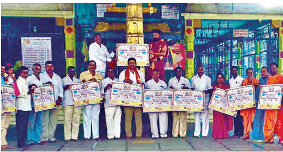
జాతర గోడవత్రికను ఆవిష్కరిస్తున్న దృశ్యం