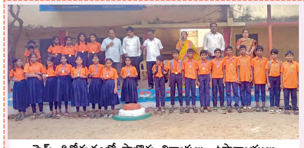
సైన్స్ దినోత్సవంలో పాల్గొన్న విద్యార్థులు, ఉపాధ్యాయులు