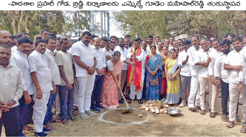
పాఠశాల ప్రవార గోడకు శంకుస్థాపన చేస్తున్న ఎమ్మెల్యే గూడెం మహిపాలరెడ్డి శంకుస్థాపన