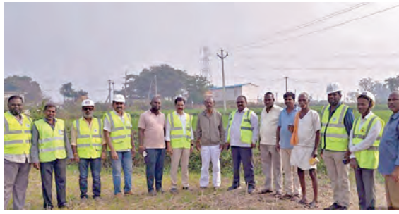
రైతులను అడిగి తెలుసుకుంటున్న విద్యుత్ శాఖ అధికారులు