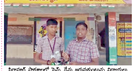
సిర్సాపూర్ పాఠశాలలో సైన్స్ డేను జరుపుకుంటున్న విద్యార్థులు