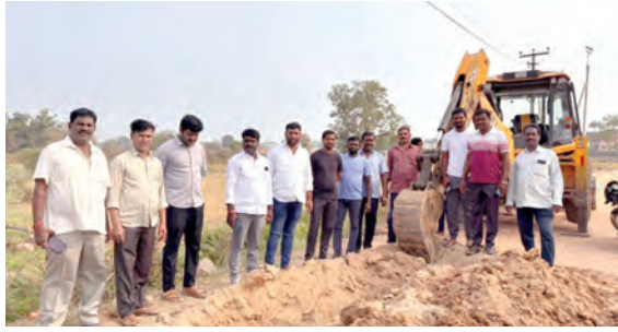
సైన్లైట్లను కోసం తవ్వకం చేస్తున్న దృశ్యం