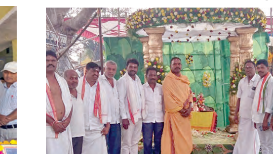
శివాలయ పునఃప్రతిష్ఠ చేస్తున్న దృశ్యం