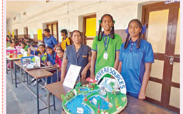
ప్రాజెక్టులను చూపిస్తున్న విద్యార్థులు