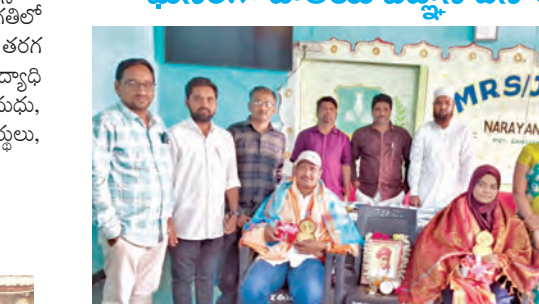
ఉపాధ్యాయులకు సన్మానం చేస్తున్న దృశ్యం