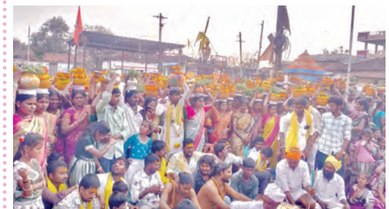
బీరప్ప జాతరలో బోనాలను ఊరేగింపు భక్తులు