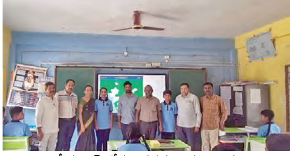
జాతీయ సైన్స్ డేను జరుపుకుంటున్న విద్యార్థులు