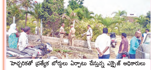
హెచ్చరికతో ప్రత్యేక బోర్డులు ఏర్పాటు చేస్తున్న ఎక్సెల్ సీం అధికారులు