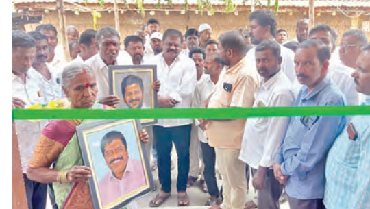
ఇందిరమ్మ ఇల్లు ప్రారంభిస్తున్న దృశ్యం