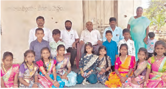
స్వయంపాలన దినోత్సవంలో పాల్గొన్న విద్యార్థుల దృశ్యం