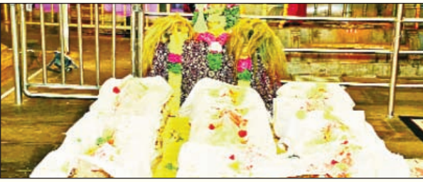
యాదగిరిగుట్ట ఫిబ్రవరి 28 (ప్రభాతవార్త) :

యాదగిరిగుట్ట శ్రీ లక్ష్మీ నరసింహ స్వామి దేవస్థానంలో