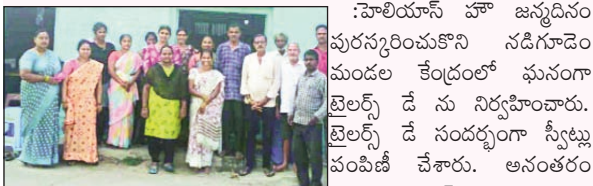
నడిగూడెం, ఫిబ్రవరి 28, ప్రభాతవార్త