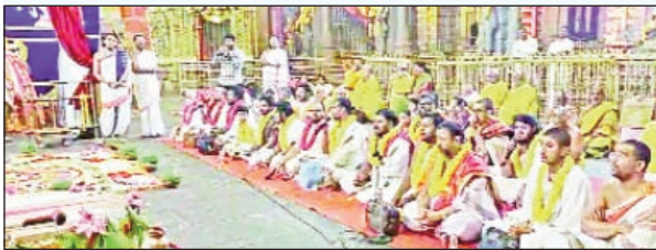
యాదగిరిగుట్ట ఫిబ్రవరి 28, (ప్రభాతవార్త) :

యాదాద్రి చరిత్ర లో మొదటి సరిగా వేద సదస్యం