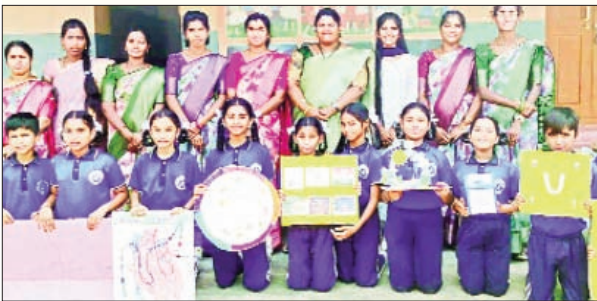
తుర్కపల్లి, ఫిబ్రవరి 28 ప్రభాతవార్త