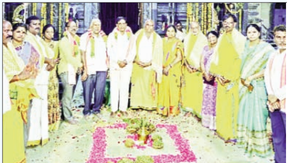
రాజాపేట, ఫిబ్రవరి 28 ప్రభాతవార్త