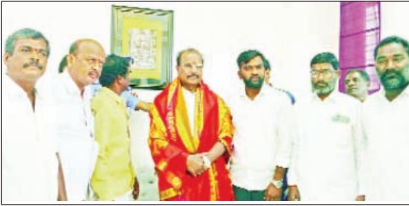
రాజాపేట, ఫిబ్రవరి 28 ప్రభాతవార్త

త్రిపుర గవర్నర్ ను సత్కరించిన బిజెపి బృందం