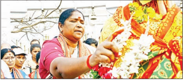
భక్తులకు నిరంతర సౌకర్యాలు

వరంగల్ సీటి ప్రభాతవార్త : తెలంగాణ సిద్దించిన తర్వాత ప్రజలకు ఆరోగ్య పరమైన సమస్యలు తీరి, ఆర్థిక పరంగా అభివృద్ధి చెందుతారని ఆశించిన స్థాయిలో సామాన్యులు నోచుకోవడం లేదు. గ్రేటర్ వరంగల్ లోని 17,43 డివిజన్ కేంద్రాల్లో ప్రాథమిక ఆరోగ్య కేంద్రం అందుబాటులో లేకపోవడం అందుకు నిదర్శనం అన్నారు. దాని వలన 24 గంటల వైద్యం, అత్యవసర మెరుగైన చికిత్స సేవలు అందడం లేదని డివిజన్ కేంద్రాల ప్రజలు అభిప్రాయం వ్యక్తం చేస్తున్నారు. కేవలం ఉప కేంద్రాలతోనే దాదాపు 15 నుంచి 20 గ్రామాలకు అరకొర వైద్య సేవలతో సరిపెడుతున్నారని మండిపడుతున్నారు. ప్రజలకు అందించాల్సిన 24 గంటల వైద్య సేవలకు మామునూరు, బొల్లి కుంట ప్రాంతాలకు 15 నుంచి 20 కిలో మీటర్ల దూరంలో పైడిపెల్లి కేంద్రంగా ప్రాథమిక ఆరోగ్య కేంద్రం ఏర్పాటు చేయడంతో ఆరోగ్య పరమైన సమస్యలు డివిజన్ ప్రజలు ఎదుర్కొంటున్నారు. ప్రజలు మెరుగైన 24 గంటల చికిత్స సేవలకు నోచుకోవడం లేదని, డివిజన్ కేంద్రంలోని గ్రామాలను ఉప కేంద్రాలతో నెట్టుకొస్తున్నారని వలపురు అభిప్రాయం వ్యక్తం చేస్తున్నారు. మామునూరు గ్రామంలో ఉన్న ఉప కేంద్రానికి సొంత భవనం లేక నెల నెలా భవనం అడుక్కొని ఆరోగ్య సేవలు కొనసాగిస్తున్నారు. గ్రేటర్ లో విలీనం చెందిన తర్వాత అభివృద్ధి చెందుతుందని భావించిన మామునూరు ప్రాంత ప్రజలకు