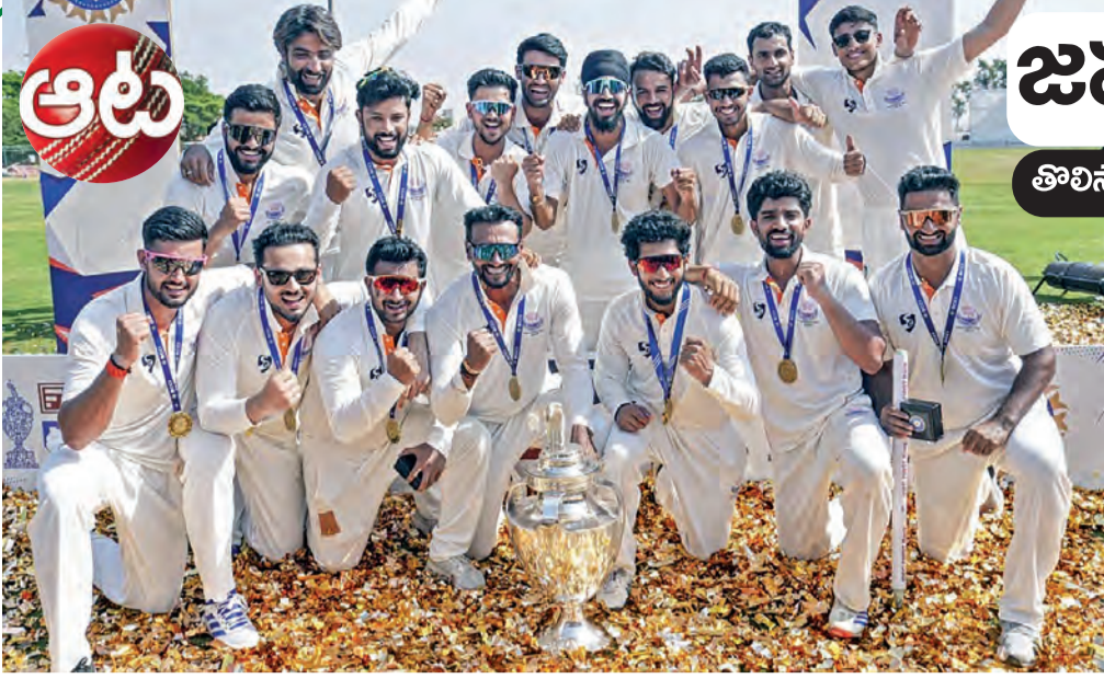
జమ్మూ కశ్మీర్ నరీక్షణ చరిత్ర అవిచ్ఛిన్నం అందింది. తొలిసారి రంజీ ట్రోఫీని ముద్దాడింది. కర్ణాటకతో ఫైనల్లో విజయ లాంఛనాన్ని ముగించి తొక్క ఛాంపియన్ గా అవతరించింది. జమ్మూ కశ్మీర్ రంజీ ట్రోఫీ సొంతం చేసుకుంది. ఛాంపియన్ గా సాధించింది. అద్భుతం నిలకడైన

తొలిసారి ఛాంపియన్ గా ఆవిర్భావం • తొలి ఇన్నింగ్స్ తో విజేత • 67వేళ్ల నరీక్షణకు తెర