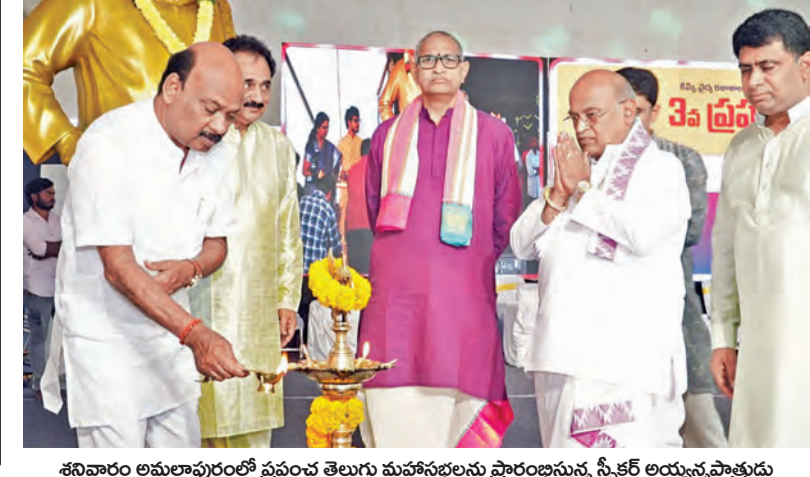
శనివారం అమలాపురంలో ప్రపంచ తెలుగు మహాసభలను ప్రారంభిస్తున్న కిమ్స్ అధ్యక్షుడు