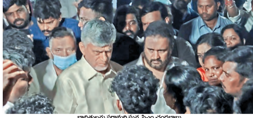
బాధితులను చరామర్చిస్తున్న సీఎం చంద్రబాబు

25 మంది దుర్మరణం మంటల్లో 20 మంది, ఆస్పత్రిలో ఐదుగురు మృతి మరికొందరి పరిస్థితి విషమం కాకినాడ జిల్లా వేట్లపాలెంలో మహావిషాదం ఘటనా స్థలాన్ని పరిశీలించిన సీఎం చంద్రబాబు పూర్తిగా ఆదుకోంటామని హామీ