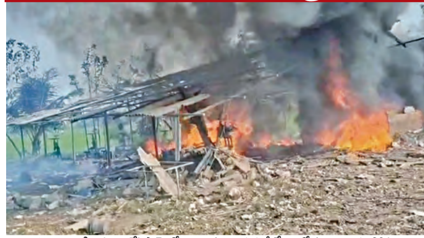
శనివారం కాకినాడ జిల్లా వేట్లపాలెంలోని బాణసంచా తయారీ కేంద్రంలో సంభవించిన విస్ఫోటం

ఉమ్మడి తూర్పుగోదావరి జిల్లా బ్యూరో, ఫిబ్రవరి 28 ప్రభాతవార్త: సామర్లకోట సమీపంలో శనివారం విషాదం చోటుచేసుకుంది బ్రతుకుతెరువు కోసం బాణసంచా తయారీ కేంద్రంలో పనిచేస్తున్న కార్మిక కార్మికులు 25 మంది కేంద్రంలో జరిగిన పేలుళ్లు మృతి చెందారు. ఎప్పుటిలాగే కార్మికులు అతి సున్నితమైన ప్రమాదకరమైన బాణసంచా తయారు