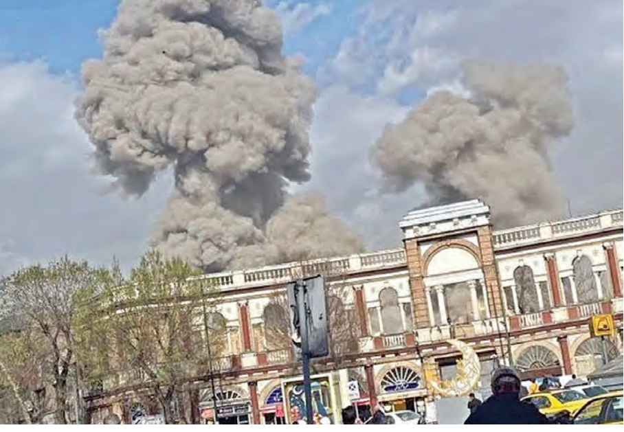
అమెరికా, ఇజ్రాయేల్ దళాలు కలిపించిన బాంబుల వర్షాలకు టెక్సాస్ లో దగ్ధమవుతున్న భవనాలు

Published from Vijayawada, Hyderabad, Visakhapatnam, Rajahmundry, Guntur, Nizamabad, Ongole, Warangal, Tirupathi, Kadapa, Kurnool, Anantapur, Karimnagar, Mahabubnagar, Khammam, Nellore, Nalgonda, Tadepalligudem, Srikakulam 1-3-2026 ఆదివారం సంపుటి: 32 సంఠిక: 29 పేజీలు: 12 వెల: 8.00