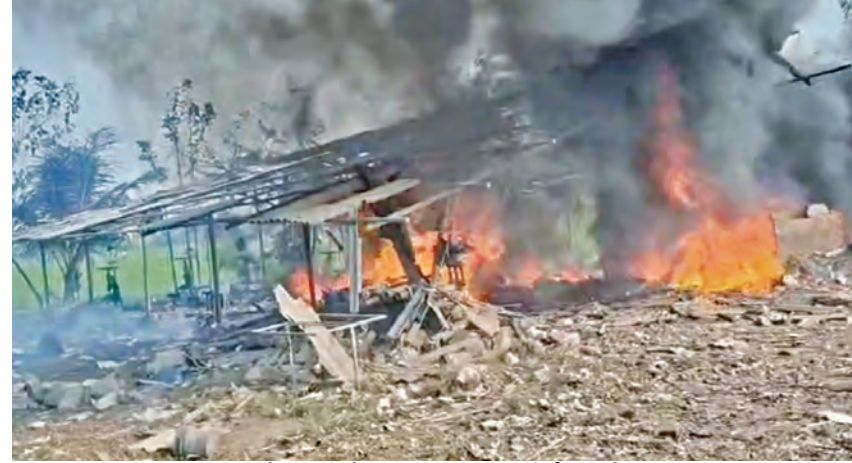
శనివారం కాకినాడ జిల్లా వేట్లపాలెంలోని బాణాసంచా తయారీ కేంద్రంలో సంభవించిన విస్ఫోటం

ఉమ్మడి తూర్పుగోదావరి జిల్లా బ్యారో, ఫిబ్రవరి 28 ప్రభాతవార్త: సామర్లకోట సమీపంలో శనివారం విమానం పోటుపెనుకుంది బ్రతుకుతెచ్చు కోసం బాణాసంచా తయారీ కేంద్రంలో పనిచేస్తున్న కార్మిక సారంగా భగ్గమని ప్రమాదం సంభవించింది. ఒక్క కార్మికులు 25 మంది కేంద్రంలో జరిగిన పేలుళ్లు మృతి చెందారు. ఎప్పటిలాగే కార్మికులు అతి సున్నీ తమైన ప్రమాదకరమైన బాణాసంచా తయారు