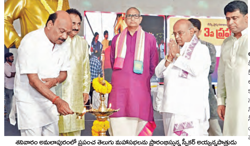
శనివారం అమలాపురంలో ప్రపంచ తెలుగు మహాసభల ప్రారంభాన్ని స్వీకరించిన అధ్యక్షుడు