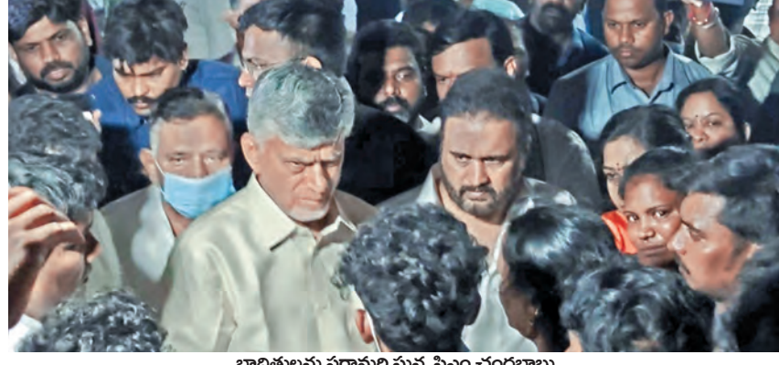
బాధితులను పరామర్శిస్తున్న సీఎం చంద్రబాబు