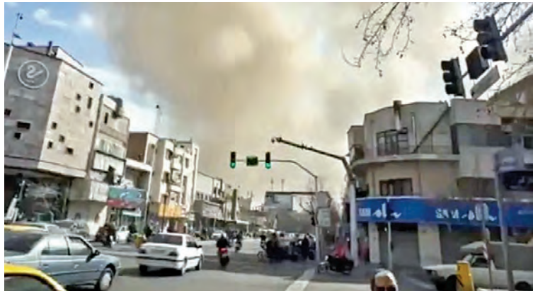
ఇజ్రాయేల్ మిస్సైల్ దాడులకు శనివారం ద్వైజ్లో దగ్గుమపుతున్న భవనాలు