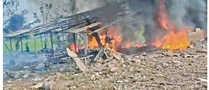
శనివారం కాకినాడ జిల్లా వేల్పూరిలోని బాణాసంచా తయారీ కేంద్రంలో సంభవించిన విస్ఫోటం

ఉమ్మడి తూర్పుగోదావరి జిల్లా బ్యారో, ఫిబ్రవరి 28 ప్రభాతకాలాల్లో సామర్లకోట సమీపంలో శనివారం విషాదం చోటుచేసుకుంది. బ్రతుకుతెరువు కోసం బాణాసంచా తయారీ కేంద్రంలో పనిచేస్తున్న కార్మిక కార్మికులు 25 మంది కేంద్రంలో జరిగిన పేలుళ్లు మృతి చెందారు. ఎప్పటికీగా కార్మికులు అతి సున్నితమైన ప్రమాదకరమైన బాణాసంచా తయారు >>6