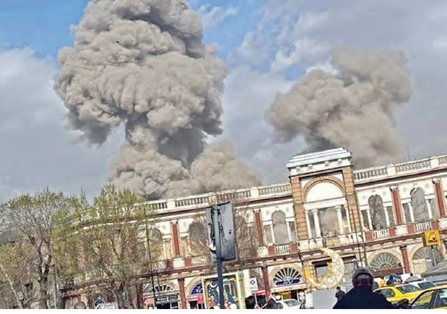
అమెరికా, ఇజ్రాయెల్ దళాలు కులిపించిన బాంబుల వర్షాలకు టెహ్రాన్ లో దగ్ధమవుతున్న భవనాలు