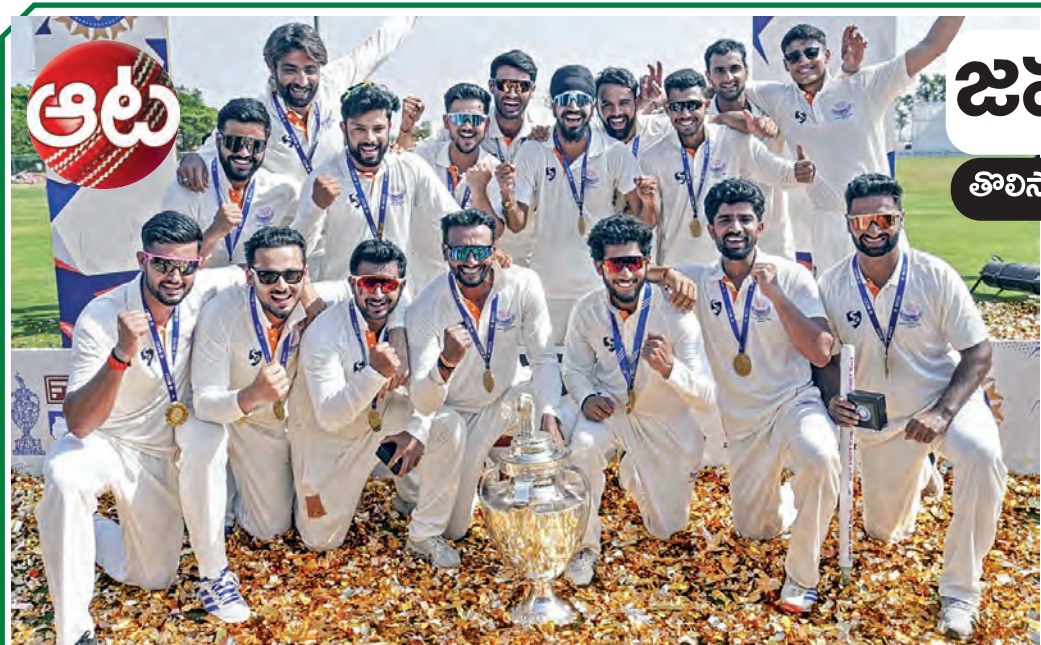
జమ్మూ కశ్మీర్ నలకొత్త చలత్ అవిప్పించింది. తొలి సారి రంజీ ట్రోఫీని ముద్దాడింది. కర్ణాటకతో ఫైనల్లో విజయం లాభనాల్ని ముగించి కొత్త చాంపియన్ గా అవతరించింది. జమ్మూ కశ్మీర్ రంజీ ఎడిషన్ లో అసాధారణ విజయాలు సాధించింది. అద్భుతం నిలకడైన