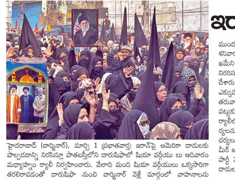
హైదరాబాద్ (బార్నినాల్), మార్చి 1 ప్రభాతవార్: ఇరాన్ పై అమెరికా దాడులకు పాల్పడడాన్ని నిరసిస్తూ పాతబస్తీలోని దారుషిఫాలో షియా వర్ణియులు ఆదివారం మధ్యాహ్నం రాత్రి నిర్వహించారు. వేలాది మంది షియా వర్ణియులు ఒక్కొక్కరిగా తరలిరావడంతో దారుషిఫా నుంచి బార్నినాల్ వైపు మార్గంలో వాహనాలను