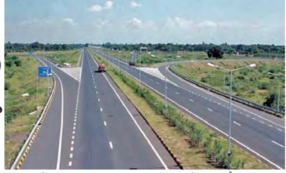
వరకూ దీన్ని విస్తరించాలని నిర్ణయించారు. దీనిపై జీవీపీ ఉమ్మడి కృష్ణాజిల్లాలో జాతీయ రహదారి విస్తరించి ఉన్న నియోజకవర్గాల ఎమ్మెల్యేలకు జాతీయ రహదారుల విభాగం అధికారుల సమావేశం ఏర్పాటు చేసి సమాన్వయం చేపట్టారు.