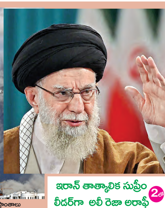
ఇరాన్ తాత్కాలిక సుప్రీం లీడర్గా అలీ రెజా అలాఫీ

విప్లవం, మార్పు 1: ఇరాన్ సుప్రీం లీడర్ ఆయెతోల్లా అలీఖమేనేని అమెరికా, ఇజ్రాయెల్ సేనలు అంతం చేసాయి. ఈ రెండుదేశాలు జరిపిన సంయుక్త దాడులలో ఖమేనేని చనిపోయారని ముందుగానే ప్రకటించినా ఇరాన్ మాత్రం దృవీకరించలేదు. చివరకు ఖమేనేని ఆక్షయం పొందుతున్న నివాససంస్థాగారి నేలమట్టం కావడంతో