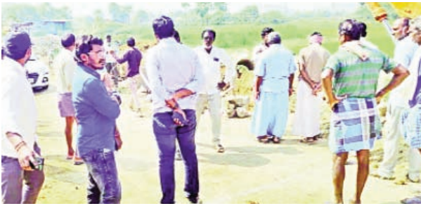
అడవి శ్రీరాంపూర్ గ్రామంలో టీఫైబర్ ఇంటర్నెట్ సేవల్లో తలెత్తుతున్న సమస్య అంతరాయంపై వినియోగదారులు ఆందోళన చెందవద్దని, అభివృద్ధి పనుల కారణంగానే ఈ ఇబ్బంది ఎదురవుతోందని ముత్తారం మండల