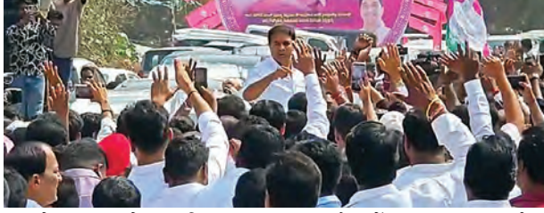
कोलीनी, ड्रीम होम्स सहित अन्य कॉलोनीयों के प्रभावित संपत्ति मालिकों और निवासियों को समर्थन का आश्वासन दिया। गांधी सरोवर परियोजना के कारण विस्थापन का सामना कर रहे निवासियों के साथ उन्होंने मार्च में भाग लिया और उनसे बातचीत की। मूसी दांडी मार्च में राव के साथ सैकड़ों बीआरएस समर्थक और स्थानीय निवासी शामिल हुए। उन्होंने कहा कि गांधी सरोवर परियोजना का मुद्दा 16 मार्च से शुरू हो रहे आगामी विधानसभा सत्र में उठाया जाएगा। साथ ही परियोजना से प्रभावित होने वाले संपत्ति मालिकों और निवासियों को बीआरएस का पूरा समर्थन देने का भरोसा दिलाया। इस दौरान कई स्थानीय निवासी केटीआर के सामने भावुक हो गए और अपने घरों को बचाने की गुहार लगाई। उनका कहना था कि उन्होंने ऋण लेकर अपने मकान बनाए हैं और वर्षों से किस्तें चुका रहे हैं। वे नियमित रूप से संपत्ति कर भी अदा कर रहे हैं और पिछले 15 वर्षों से वहीं रह रहे हैं। निवासियों ने कहा कि वे गांधी सरोवर परियोजना के नाम पर अपने घरों को ध्वस्त किए जाने के फैसले का विरोध करते हैं और चाहते हैं कि उनके घर सुरक्षित रहें।