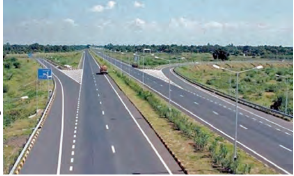
వరకూ దీన్ని విస్తరించాలని నిర్ణయించారు. దీనిపై జీవీపీ ఉమ్మడి కృష్ణాజిల్లాలో జాతీయ రహదారి విస్తరించి ఉన్న నియోజకవర్గాల ఎమ్మెల్యేలకు జాతీయ రహదారుల విభాగం అధికారుల సమావేశం ఏర్పాటు చేసి సమాన్వయం చేపట్టింది.