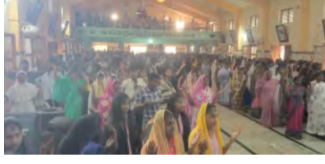
నిర్వహించారు.అలాగే గ్రామాలలో ప్రతిరోజు సాయంత్రం చర్చిలలో ప్రత్యేక ప్రార్థనలు, వాక్యావదేశాలు నిర్వహిస్తూ ఆధ్యాత్మిక చింతనలో గడుపుతున్నారు.

కామవరపుకోట, మార్చి 1(ప్రభాత వార్త): మండల వ్యాప్తంగా గ్రామాల్లో లెంట్ (శ్రమ దినాల) ప్రార్థనలు అత్యంత భక్తి శ్రద్ధలతో కొనసాగుతున్నాయి.గత నెల ఫిబ్రవరి 18న 'భగవద్ బుధనారం'తో ప్రారంభమైన ఈ నలభై రోజుల ఉపవాస దీక్షలు ఆదివారం నాటికి పన్నెండోవ రోజుకు చేరుకున్నాయి. ఈ సందర్భంగా ఆదివారం కావడంతో మండల వ్యాప్తంగా ఉన్న చర్చిల్లో క్రైస్తవులు ప్రత్యేక ప్రార్థనలు నిర్వహించారు. యేసుక్రీస్తు పడిన శ్రమలను స్మరిస్తూ క్రైస్తవ సోదరులు భక్తి పాఠపఠ్యంలో మునిగిపోయారు. ఉదయం నుండి చర్చిలకు పోతెట్టిన క్రైస్తవ విశ్వాసులు ఊబిల్ పఠనం, ఆరాధన గీతాలతో ప్రత్యేక ప్రార్థనలు