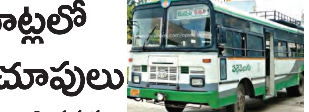
విత్తూరు, అన్నమయ్య, అనంతపురం తదితర జిల్లాల సరిహద్దుల్లో ఉన్న నియోజకవర్గాల్లో ఉత్సాహంతో తోంది. ఉదాహరణకు విత్తూరు జిల్లా కుప్పం నుంచి కర్ణాటకలోని కెజిఎఫ్ సుమారు 30 కిలో మీటర్ల దూరంలో ఉంది. ఈ మార్గంలో ఆంధ్ర సరిహద్దు సుమారు 20కి.మీ.లు ఉంటుంది. అయితే ఈ 20కి.మీ.ల దూరం కూడా అడ్మిట్ అధికారులు మహిళలకు ఉపిత బస్సు ప్రయాణం అనుమతించడం లేదు. ఇలా అంతరాష్ట్ర రూట్లలో తిరిగి అడ్మిట్ బస్సుల్లో ఉపిత ప్రయాణం అడ్మిట్ అధికారులు అంతరాష్ట్ర రూట్లలో పోవడంతో మహిళలు వాటితోపాటు, మహిళలకు ఉపిత బస్సు ప్రయాణం అడ్మిట్ అనుమతులు లేవని కలెక్టర్లు పేర్కొంటున్నట్లు మహిళలు పేర్కొంటున్నారు. ఈ తరహా సమస్యలే రాష్ట్రంలోని జిల్లాల్లో ఉన్న సరిహద్దు నియోజకవర్గాల్లో ఉపిత బస్సు ప్రయాణం ఎదురవుతున్నాయి. ఇప్పటికైనా సంబంధిత శాఖ మంత్రి, ఉన్నతాధికారులు స్పందించి సరిహద్దు నియోజకవర్గాల నుంచి అంతరాష్ట్ర రూట్లలో తిరిగి అడ్మిట్ బస్సుల్లో కూడా మహిళలకు ఉపిత బస్సు ప్రయాణం సీ జెడ్ పథకం అమలుచేస్తూ చూస్తారని మహిళలు ఆశా

కుప్పం, మార్చి 1 ప్రభాతవార్: సీఎం చంద్రబాబునాయుడు ఎన్నికలకు ముందు ప్రకటించిన అమలు చేస్తున్న సూపర్ సెక్యూర్టీ పథకాల్లో ఒకటిగా ప్రకటించిన సీ జెడ్ పథకం రాష్ట్రంలో దిగజరడం అమలు చేయడం, మహిళలకు అడ్మిట్ బస్సులో ఉపిత ప్రయాణం కల్పిస్తూ ఈ పథకం అమలు చేస్తున్నారు. సీ జెడ్ పథకం రాష్ట్రంలో సూపర్ సెక్యూర్టీ అమలు చేయడం, మహిళలకు అడ్మిట్ బస్సులో ఉపిత ప్రయాణం కల్పిస్తూ ఈ పథకం అమలు చేస్తున్నారు. సీ జెడ్ పథకం రాష్ట్రంలో సూపర్ సెక్యూర్టీ అమలు చేయడం, మహిళలకు అడ్మిట్ బస్సులో ఉపిత ప్రయాణం కల్పిస్తూ ఈ పథకం అమలు చేస్తున్నారు. సీ జెడ్ పథకం రాష్ట్రంలో సూపర్ సెక్యూర్టీ అమలు చేయడం, మహిళలకు అడ్మిట్ బస్సులో ఉపిత ప్రయాణం కల్పిస్తూ ఈ పథకం అమలు చేస్తున్నారు.