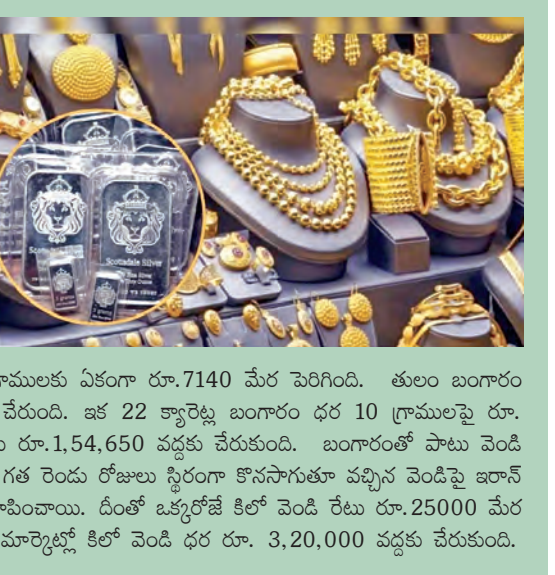
హైదరాబాద్ మార్కెట్లో బంగారం ధరలు ఒక్కసారిగా పెరిగాయి. ఈరోజు 24 క్యారెట్ల బంగారం రేటు 10 గ్రాములకు ఏకంగా రూ.7140 మేర పెరిగింది. తులం బంగారం ధర రూ. 1,68,710 వద్దకు చేరుంది. ఇక 22 క్యారెట్ల బంగారం ధర 10 గ్రాములపై రూ. 6,550 మేర పెరి తులం రేటు రూ.1,54,650 వద్దకు చేరుకుంది. బంగారంతో పాటు వెండి రేటు సైతం భారీగా పెరిగింది. గత రెండు రోజులు స్థిరంగా కొనసాగుతూ వచ్చిన వెండిపై ఇరాన్ అమెరికా దాడులు ప్రభావం చూపింపాయి. దీంతో ఒక్కరోజే కిలో వెండి రేటు రూ.25000 మేర పెరిగింది. దీంతో హైదరాబాద్ మార్కెట్లో కిలో వెండి ధర రూ. 3,20,000 వద్దకు చేరుకుంది.

ముంబయి, మార్చి 1: బంగారం, వెండి ధరలు ఊహించని విధంగా పెరుగుతున్నాయి. అమెరికా ఇరాన్ ఇజ్రాయెల్ ఉద్రిక్తతలు పసిడి ధరలను అమాంతం పెంచేశాయి. ఇరాన్ పై అమెరికా, ఇజ్రాయెల్ ద్వైపక్షాలతో విరుచుకుపడడం, ఊహించని విధంగా ఇరాన్ ప్రతిదాడులు చేయడం ప్రపంచాన్ని ఉలిక్కిపడేలా చేసింది. బంగారం ధరలు ఒక్కసారిగా పెరిగాయి. తులం బంగారం రేటు ఏకంగా రూ.7 వేల పైనే పెరిగింది. కిలో వెండి రేటు ఒక్కరోజే రూ.25000 మేర పెరిగింది. ఈ క్రమంలో దేశీయ మార్కెట్లో బంగారం, వెండి రేట్లు మార్చి 1వ తేదీన భారీగా పెరిగాయి. అంతర్జాతీయ మార్కెట్లో స్పాట్ గోల్డ్ రేటు ఖాస్సుకు ఒక్కరోజే 100 డాలర్ల పైనే పెరిగింది. ఖాస్సు పసిడి రేటు 5278 డాలర్ల పైకి ప్రేక్షింపబడింది. ఇక స్పాట్ సిల్వర్ రేటు ఖాస్సుకు ఒక్కరోజే 7.59 శాతం పెరిగింది. ఖాస్సు వెండి రేటు 93.72 డాలర్ల పైకి చేరుకుంది. అంతర్జాతీయంగా నెలకొన్న ఉద్రిక్తతలు దేశీయ మార్కెట్ పై ప్రభావం చూపింపాయి.