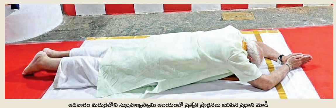
అదివారం మదురైలోని సుబ్రహ్మణ్యస్వామి ఆలయంలో ప్రత్యేక ప్రార్థనలు జరిపిన ప్రధాని మోడీ