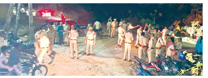
అందోల్ మ్యూజికల్ సెషన్లను బలగాలు