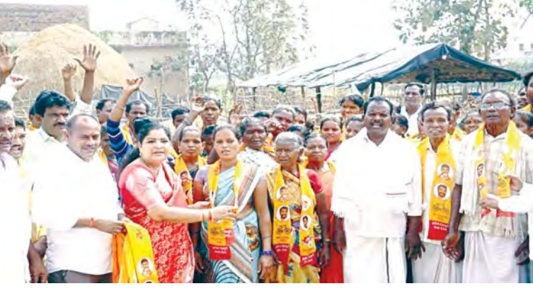
పారిశుధ్యం మార్చి ఒకటి ప్రభుత్వం