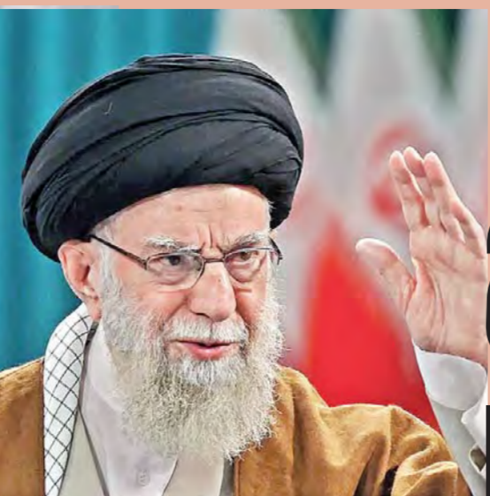
ఇరాన్ తాత్కాలిక సుప్రీం లీడర్ గా అలీ రజా అలాఫీ