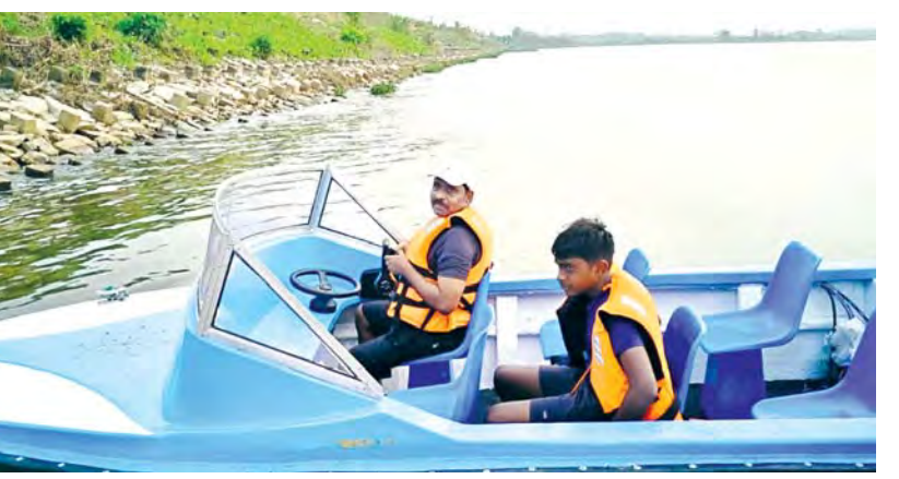
పార్కులో పర్యాటక హంగులు