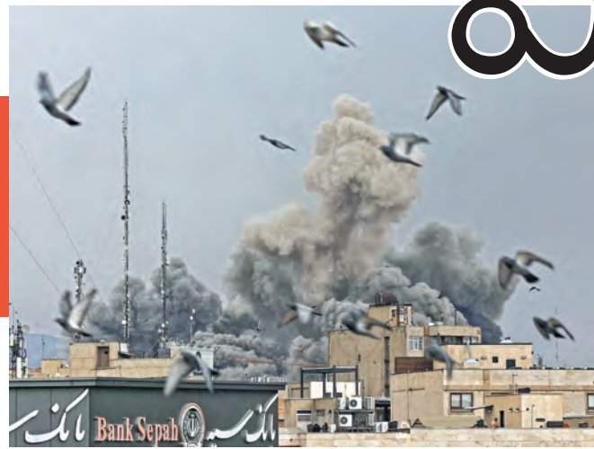
ఇజ్రాయెల్-అమెరికా బాంబు దాడికి ఇరాన్ లో ఎగిరిపోతున్న శాంతికపోతాలు