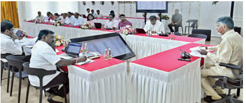
సోమవారం అమరావతిలో ఆర్టిజిఎస్ పై సమీక్షలో మాట్లాడుతున్న సిఎం చంద్రబాబు

డ్రోన్, సిసిటివి, శాటిలైట్ దేటా సమీకృతం చేసే మెకానిజం బాణాసంచా పేలుళ్ల నివారణకు శివకాశి విధానాలపై అధ్యయనం బస్ స్టేషన్లలో వేసవి సౌకర్యాలు ఆర్టిజిఎస్ సమీక్షలో సిఎం చంద్రబాబు