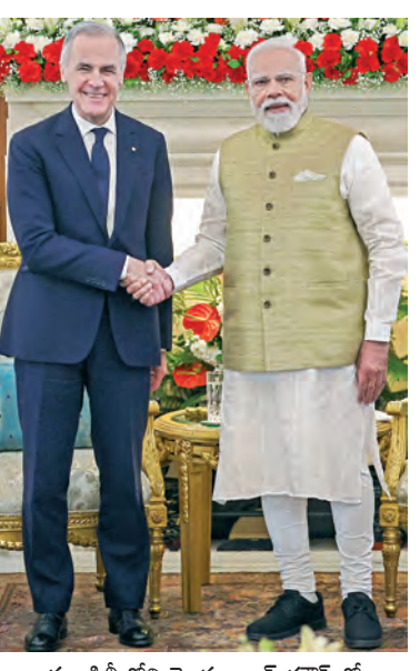
న్యూఢిల్లీలోని హైదరాబాద్ హౌస్ లో సోమవారం ప్రధాని మోడీతో భేటీ అయిన కెనడా ప్రధాని మార్క్

నీటికి ప్రయోజనాలకు ఎలాంటి ఇబ్బంది తలెత్తకుండా చర్యలు తీసుకోవాలని చెప్పారు. బస్ స్టేషన్లకు వచ్చిన దగ్గర నుంచి గమ్యస్థానం చేరే వరకు ప్రయాణం సౌకర్యవంతంగా జరిగేలా పరిస్థితులు ఉండాలన్నారు. ఆర్టిజి బస్ స్టేషన్లను బావున్నా... ఆర్టిజి బస్ స్టేషన్లలో సౌకర్యాలు, ఔట్ సౌథ్స్ సర్వీసులు మెరుగ్గా ఉండేలా చర్యలు చేపట్టాలి అన్నారు. పుంగ నూరు, వెంటటగిరి, పెనుకొండ, ప్రొద్దుటూరు, ఎమ్మిగనూరు, శ్రీకాళహస్తి బస్ స్టేషన్లలో తాగునీరు, టాయిలెట్స్, ఫ్యాన్స్, సీటింగ్ ఏరియాపై ప్రయోజనాల నుంచి అసంతృప్తి... మొత్తం రాష్ట్రంలోని అన్ని బస్ స్టేషన్లలో టాయిలెట్స్ మరమ్మతులు పూర్తి చేయాలని సీఎం ఆదేశించారు. బస్ స్టేషన్లకు వచ్చిన దగ్గర నుంచి గమ్యస్థానం చేరే వరకు ప్రయాణం సౌకర్యవంతంగా ఉండాలి... రాష్ట్రంలో వరుస ప్రమాదాలు, సంఘటనలపై అప్రమత్తంగా ఉండాలి, ముందుస్తు జాగ్రత్త చర్యలు తీసుకోవాలన్నారు. బాణాసంచా పేలుడు ఘటనలు పునరావృతం కాకుండా రక్షణ చర్యలపై శివకాశి వెళ్లి అధ్యయనం చేయాలని సీఎం ఆదేశించారు. రిజిస్ట్రేషన్ శాఖలో స్టాఫ్ బుకింగ్, డిజిటల్ సేవలు, సిబ్బంది ప్రవర్తనపై సంభ్రతి >>2