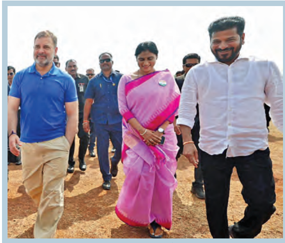
వికారాబాద్ లో డి.సి.సి అధ్యక్షుల సమావేశానికి వెళ్తున్న కాంగ్రెస్ అగ్రనేత రాహుల్, తెలంగాణ సీఎం కేసీఆర్, ఎపి పి.సి.పీ చర్యల