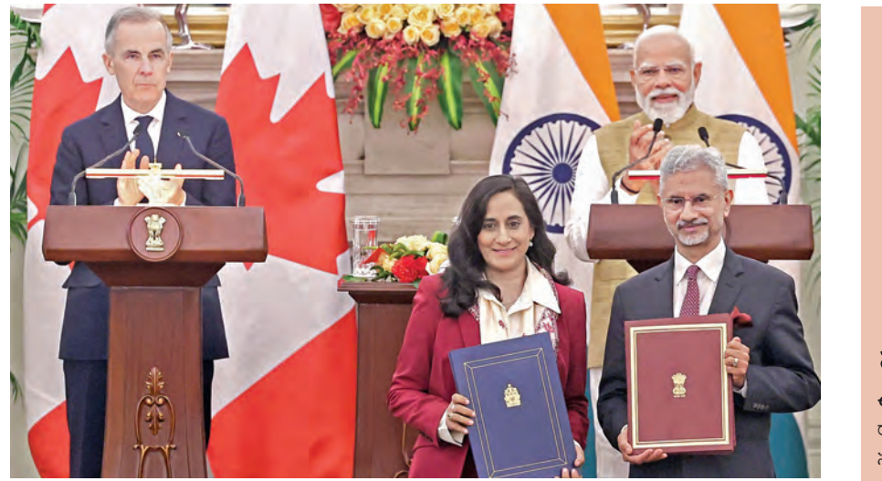
న్యూఢిల్లీలోని హైదరాబాద్ హోటల్ సోమవారం ప్రధాని మోడీ, కెనడా ప్రధాని మార్టీ సమక్షంలో ఒప్పంద పత్రాలు మార్చుకోవడాన్ని ఇరు దేశాల విదేశాంగ మంత్రులు

తెలిపారు. అయితే పీటన్నింటినీ సులభంగా వినియోగించుకునేలా ప్రజలకు అవకాశం కల్పించాలని సీఎం చెప్పారు. ముఖ్యమంత్రి అంటే పెత్తందారు కాదు. ప్రజా సేవకుడు. కూటమి ప్రభుత్వం సంక్షేమం, అభివృద్ధి లక్ష్యంగా పనిచేస్తోంది. తల్లికి వందనం కింద విదాదికి రూ.10,090 కోట్లు 67 లక్షల మంది విద్యార్థుల తల్లుల ఖాతాల్లో జమ చేస్తున్నాం. అదభీష్టలకు ఉచిత బియ్యం ప్రయోగ సౌకర్యం కోసం స్త్రీ శక్తి పథకం తీసుకువచ్చాం. దీపం పథకం కింద విదాదికి మూడు గ్యాస్ సిలిండర్ల ఉచితంగా అందిస్తున్నాం. వాల్చీప్ గవర్నెన్స్ ద్వారా పౌరుల వద్దకి ప్రభుత్వ సేవలు అందేలా చర్యలు తీసుకుంటున్నాం. సంజీవని కార్యక్రమం ద్వారా ఐదు కోట్ల ప్రజల ఆరోగ్యానికి భరోసా కల్పిస్తున్నాం. పేదరికం లేని రాష్ట్రం లక్ష్యంగా