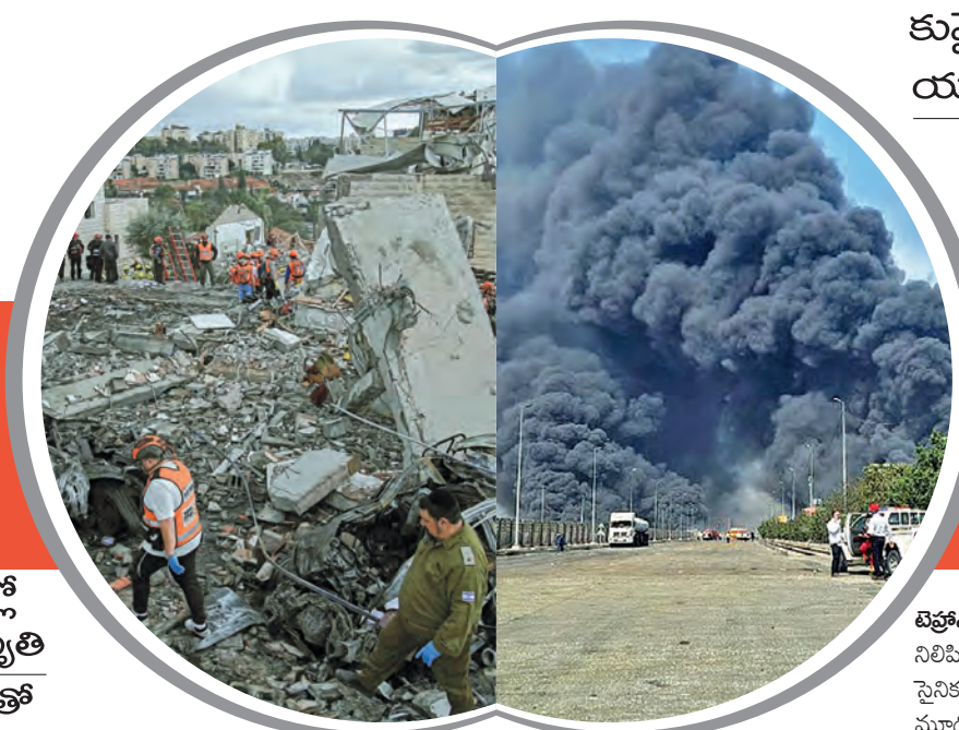
ఇజ్రాయెల్-అమెరికా దాడులతో ఇరాన్ లో నేలకూలిన భవనాలు, ఎగసిపడుతున్న పొగలు

ఇజ్రాయెల్ దాడుల్లో ఖమేనీ సతీమణి మృతి హర్రాక్ మూసివేతతో చమురు ధరలకు రెక్కలు