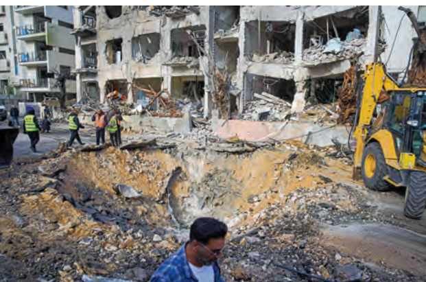
ఇజ్రాయెల్-ఆమెరికా బాంబు దాడులతో టెహ్రాన్ లోని ఇక్కడ మద్దె పర్చుడిన గొయ్యి