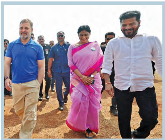
వికారాబాద్ లో డిసిసి అధ్యక్షుల సమావేశానికి వెళ్తున్న కాంగ్రెస్ అగ్రనేత రాహుల్ సింగ్ రేవంత్, ఎపి పిసిసి టీపీ చర్యలు