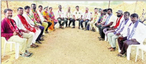
జనగామ కల్వరల్, మార్చి 2 ప్రభాతవార్త :