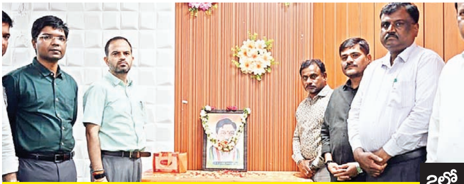
2లో ప్రజాస్వామ్య విలువలకు కట్టుబడిన మహా నాయకుడు శ్రీపాదరావు..