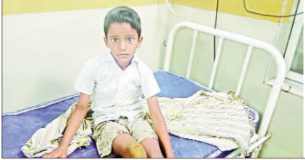
బచ్చన్నపేట, మార్చి 2 ప్రభాతవార్త :