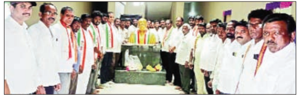
.మహాముత్తారం, మార్చి 2, ప్రభాతవార్త