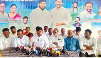
వైసీపీ నేతలు డిమాండ్ అనకాపల్లి మార్చి 2 (ప్రభాత వార్త)