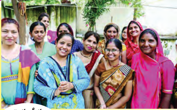
అంతర్జాతీయ మహిళా వారోత్సవాల సందర్భంగా..