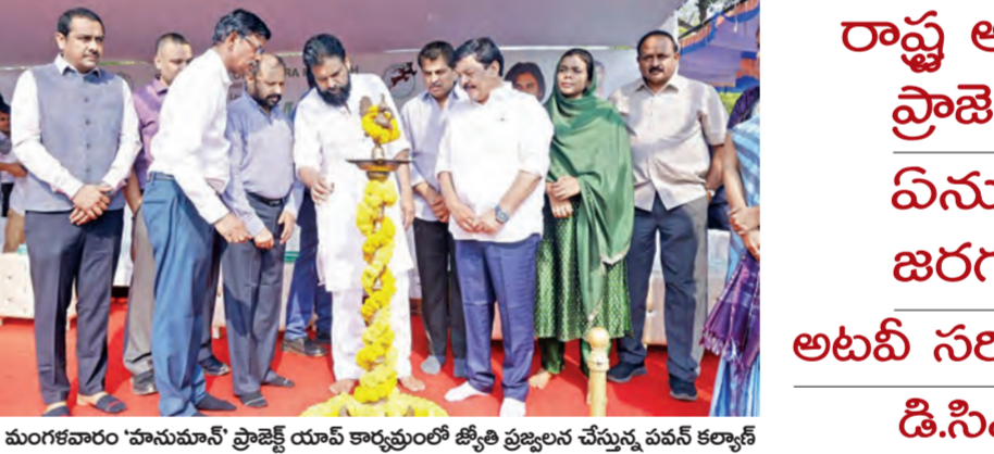
మంగళవారం 'హనుమాన్' ప్రాజెక్ట్ యావత్ కార్యక్రమంలో జ్యోతి ప్రజ్ఞలను చేస్తున్న పవన్ కల్యాణ్

నాలు ఉన్నాయి. మొదట ర్యాపిడ్ రిస్పాన్స్ వాహనాలు, హనుమాన్ అంబులెన్స్ లను పరిశీలించి సౌకర్యాలను అడిగి తెలుసుకున్నారు. ఆంధ్రప్రదేశ్ అటవీ శాఖ పరిధిలో నంబరెంట్ వన్యప్రాణులు వివరాలు, సంరక్షణకు తీసుకుంటున్న చర్యలు, రెస్క్యూ ఆపరేషన్ లో వినియోగించే కిట్లు, జనావాసాల్లోకి వచ్చిన పులులు లాంటి వస్త్ర మృగాలను బంధించే బోన్లు, అటవీశాఖ పరిధిలో పెరిగి జంతుల మొత్తంపై పులుల వివరాలను అధికారులు, ఎన్టీఆర్ గ్యాలరీల రూపంలో పవన్ కల్యాణ్ కి వివరించారు. ఈ క్రమంలో ఫుట్ పాత్ లో నం